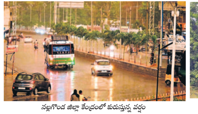
నల్లగొండ జిల్లా కేంద్రంలో కురుస్తున్న వర్షం

పల్లిలో 5.0, మరిగూడలో 3.5, అడవిదేవుల పల్లిలో 3.0, గట్టుపల్లిలో 2.3, చందూర్లో 1.0, అత్యల్పంగా చింతలపల్లిలో 0.5 మి.మీ. వర్షం పడింది.