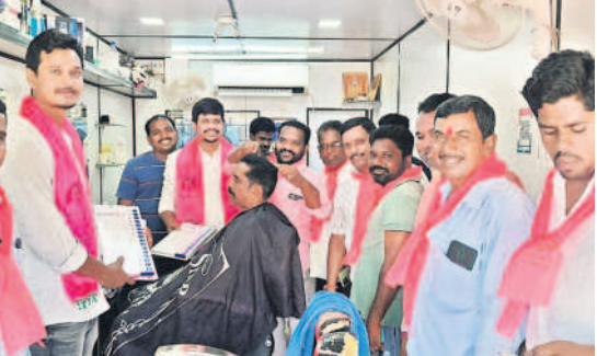
నార్యాల్ వద్ద : ఇంటింటి ప్రచారం చేస్తున్న బీఆర్ఎస్ నాయకులు