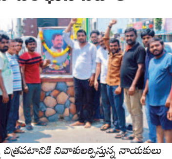
రామన్న చిత్రవటానికి నివాళులర్పిస్తున్న నాయకులు