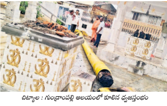
చిట్టాపల్లి : గుండ్రాంపల్లి అలయంలో కూలిన ధ్వజస్తంభం