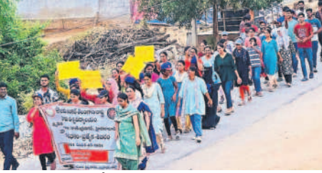
ర్యాలీ నిర్వహిస్తున్న విద్యార్థులు