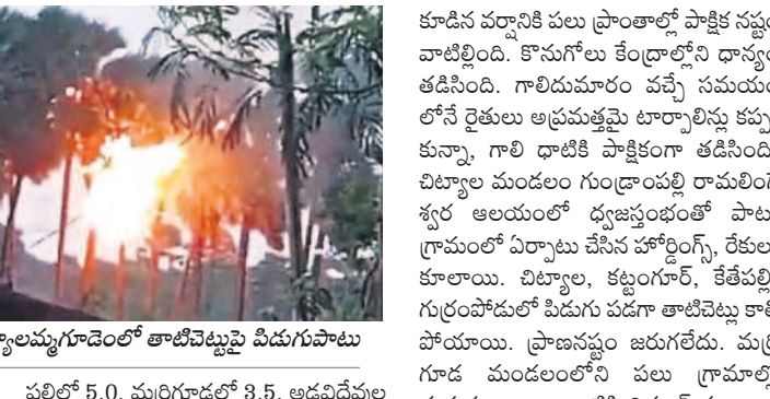
కట్టంగూర్ : ముఖ్యమంత్రిగౌడెంట్ తాటిచెట్టుపై పిడుగుపాటు