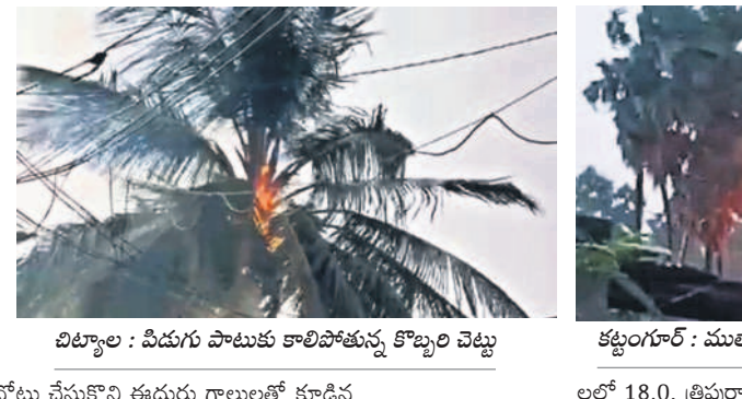
చిట్టాపల్లి : విడుదల పాటుకు పాల్గొన్న కొబ్బరి చెట్టు

నల్లగొండ, మే 5 : పక్షం రోజులుగా నిప్పుల కొలిమిలా ఉన్న నల్లగొండ జిల్లా అదివారం సాయంత్రం కురిసిన వర్షానికి ఒక్కసారిగా చల్లబడింది. జిల్లాలో ఉష్ణోగ్రతలు క్రమంగా పెరుగుతూ జీవితం 47 డిగ్రీలకు చేరువవుతుండడంతో జనం ఎండ తీవ్రతకు ఊక్తి తీసుకున్నారన్నారు. కాలపు, ఏసీలు కూడా పని చేయలేని పరిస్థితి నెలకొనడంతో ఉక్కుపాత తో అల్లాడారు. ఇలాంటి సమయంలో కురిసిన వర్షంతో ఊరల చెందారు. జిల్లాలోని పలు ప్రాంతాల్లో సుమారు గంటన్నర పాటు మోస్తూ నుంచి భారీ వర్షం పడింది.