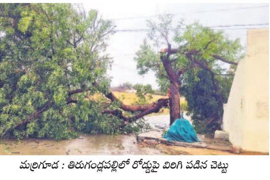
మరిగూడ : తిరుగుబాటుపల్లిలో రోడ్డుపై విరిగి పడిన చెట్టు