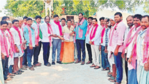
శాలిగోరారం : గురజాలలో ప్రచారంలో పాల్గొన్న బీఆర్ఎస్ నాయకులు