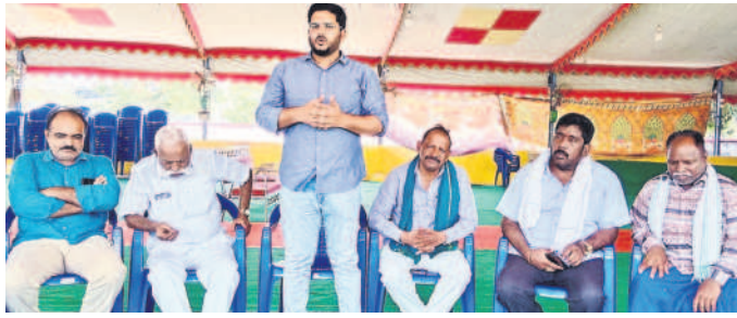
సమావేశంలో మాట్లాడుతున్న బీఆర్ఎస్ నాయకుడు నల్లమోతు సిద్ధార్థ