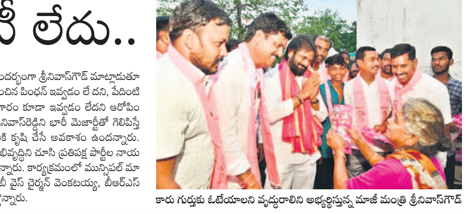
కారు గుర్తుకు ఓటియాలని వృద్ధురాలిని అభ్యర్థిస్తున్న మాజీ మంత్రి శ్రీనివాస్ గౌడ్