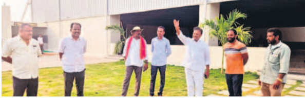
పల్నాటి నుండి పరిశీలించిన మాజీ ఎమ్మెల్యే జైపాల్ యాదవ్