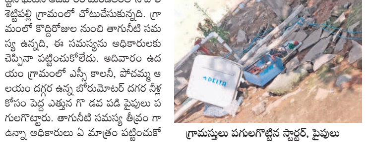
గ్రామస్థులు పగులగట్టిన స్ట్రాక్టర్, పైపులు

బర్లె పై డైవర్లు, బర్లె రిఫైలర్ల ఏర్పాటుకు అధికారుల ఆడిశాలు కొల్లూరు రూర్, మే 5 : ఈ సీజన్ లో బోఫా డిశాల నుంచి వచ్చి కృష్ణానది తీరం వెంట కనువిందు చేసే గ్రేటర్ ఫైమింగోలను అధికారికంగా గుర్తించారు. ఆదివారం సమస్య తెలంగాణలో హైదరాబాద్ లైన్ విద్యుత్ తాకిడి గ్రేటర్ ఫైమింగోల ప్రామాణిక కోల్పోతున్నారని కడప ప్రభుత్వం ప్రకటించింది. స్పందించి కొల్లూరు పారిశుధ్య శరత్ కేంద్రం, వెంటక గ్రామాల సమీపంలోని తీరం వెంట ఉన్న ఫైమింగోలను పరిశీలించారు. మంచాలకట్ట వద్ద కృష్ణానదిలో ఉన్న ఫైమింగోలను లైన్ తాకిడి మృతి చెందిన ఫైమింగోలను వారు పరిశీలించి అక్కడే పోషకాహారం నిర్వహించి ఖానం చేశారు. అలాగే బోఫాలో మంచాలకట్ట నుంచి మల్లె