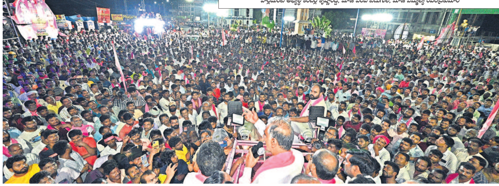
నల్లగొండ రోడ్ షోకు పెద్ద ఎత్తున హాజరైన జనం