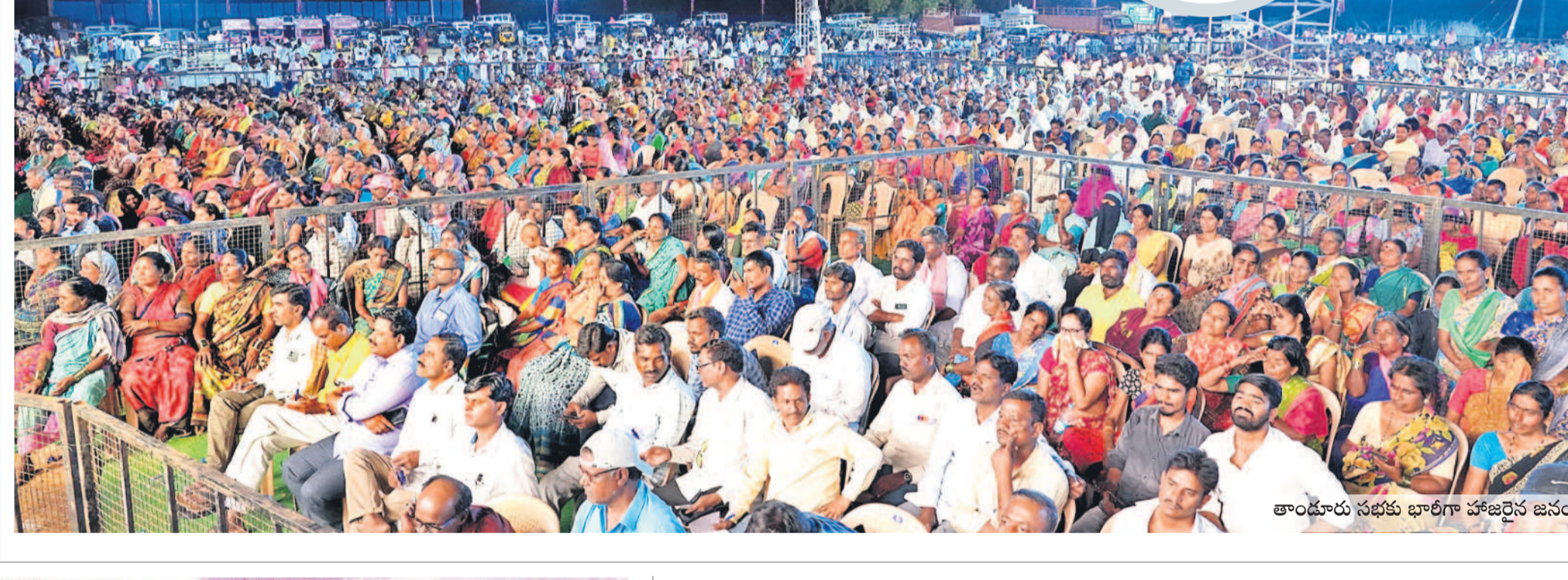
తాండూరు సభకు భారీగా హాజరైన జనం