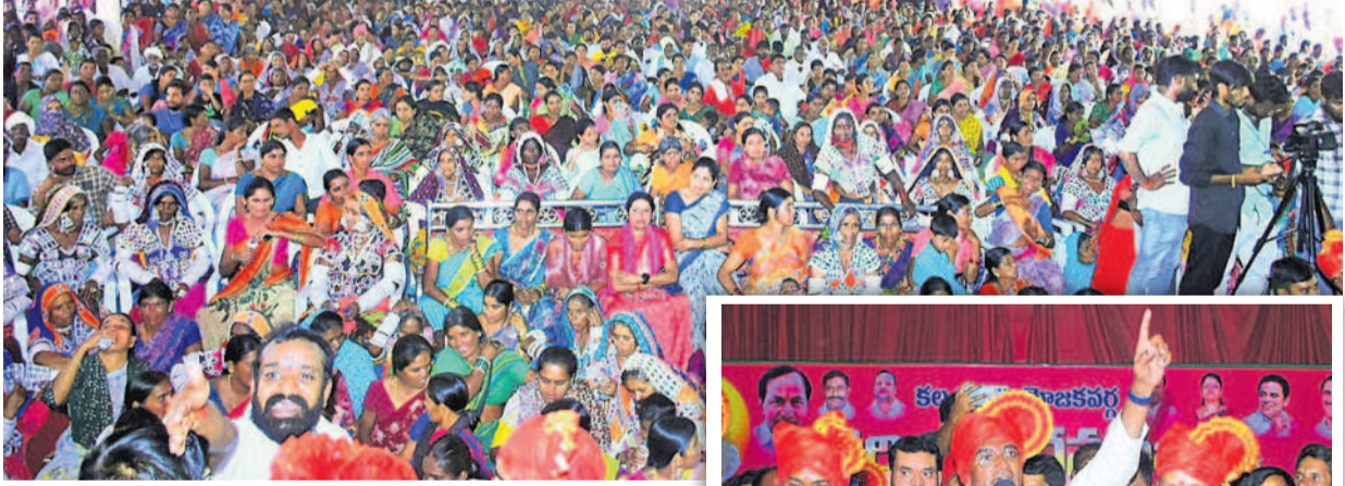
ఆమనగల్లు గిరిజన గర్జన సభలో కిక్కిరిసిన జనం