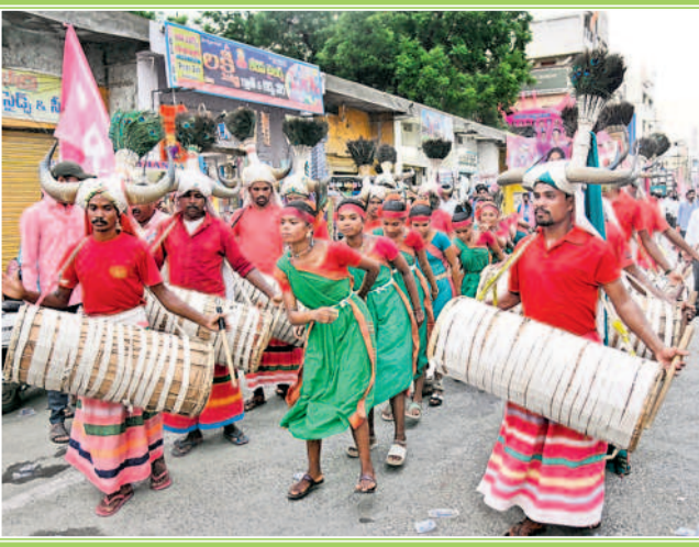
అదివాసీ కళాకారుల ప్రదర్శన