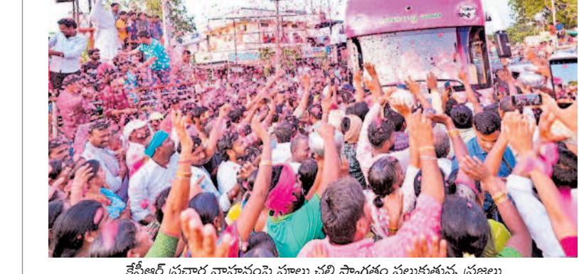
కేసీఆర్ ప్రవార వాహనంపై పూలు చల్లి స్వాగతం పలుకుతున్న ప్రజలు