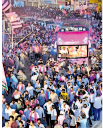
ఇల్లెందుల బైపాస్ రోడ్డు నుంచి రాత్రిగా వస్తున్న బీఆర్ఎస్ అధినేత కేసీఆర్

మహబూబాబాద్, మే 1 (నమస్తే తెలంగాణ) : బీఆర్ఎస్ అధినేత కేసీఆర్ రోడ్ షోకు జనం ప్రభంజనమై కదిలివచ్చారు. నలుదిక్కుల (వరంగల్, ములుగు, భద్రాద్రి కొత్తగూడెం, మహబూబాబాద్ జిల్లాలు) నుంచి బీమలపుట్టల్లోంచి బారులు తీరినట్లు కదంతొక్కారు. ఏజెన్సీ సహా అన్ని ప్రాంతాల నుంచి దండులా రావడంతో మహబూబాబాద్ పట్టణం జనసంద్రమైంది. బస్సుయాత్ర జిల్లాలో ప్రవేశించింది మొదలు అడుగుడుగునా నీరాజనం పలికారు. డప్పుల పుళ్ళ సదసు నిచ్చిన బతుకమ్మలు, బోనాలతో ఎదురే ఘన స్వాగతం పలికారు. భారీ కటౌట్లు, గులాబీ తోరణాలతో మానుకోట ప్రాంతమంతా గులాబీమయమైంది. కేసీఆర్ బస్సు పైకి రాగానే రోడ్డుప్రాంతా 'కేసీఆర్.. కేసీఆర్.. సీఎం సీఎం' అంటూ నినాదాలతో గెలిపిస్తారని ఆశిస్తున్నా. మీ వారం సాయంత్రం కొత్తగూడెం నుంచి బయల్దేరి మహబూబాబాద్ పట్టణానికి చేరుకున్నారు. జిల్లా ఆసుపత్రు ముందు నుంచి ఇందిరాగాంధీ సెంటర్ వరకు చేరుకున్నారు. కేసీఆర్ తన ప్రసంగంలో మానుకోట అని ప్రస్తావించినప్పుడల్లా ప్రజల