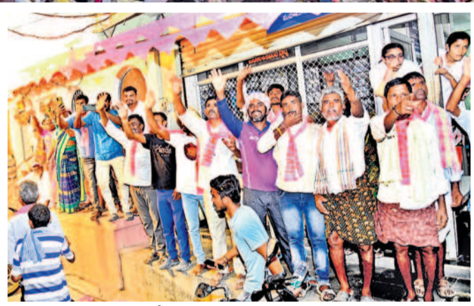
కేసీఆర్ కు అభివాదం చేస్తున్న ప్రజలు