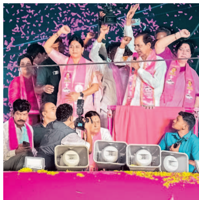
మహబూబాబాద్ రోడ్ షోలో జైకొడుతున్న కేసీఆర్, బిత్తల అభ్యర్థి మాలోత్ కవిత, ఎమ్మెల్యే సత్యపతి