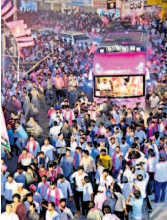
ఇల్లెందుల బైపాస్ రోడ్డు నుంచి రాత్రిగా వస్తున్న బీఆర్ఎస్ అధినేత కేసీఆర్

నలుదిక్కుల నుంచి కదిలొచ్చిన జనం బతుకమ్మలు, బోనాలతో ఘనస్వాగతం ఆటపాలతో హోరెత్తిన పట్టణం కేసీఆర్ రోడ్ షో గ్రాండ్ సక్సెస్