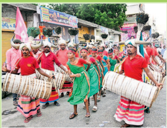
అదివాసీ కళాకారుల ప్రదర్శన