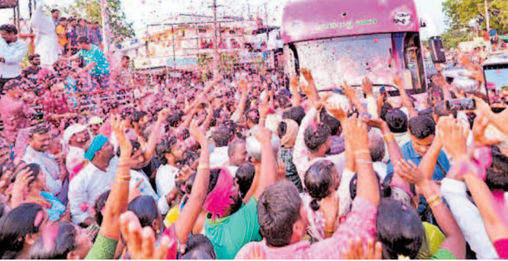
కేసీఆర్ ప్రవార వాహనంపై పూలు చల్లి స్వాగతం పలుకుతున్న ప్రజలు