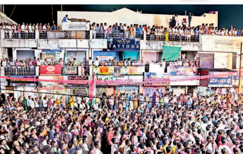
బిల్డింగ్ పైనంచి కేసీఆర్ ప్రసంగాన్ని ఆసక్తిగా వింటున్న ప్రజలు

ప్రయాణం ఒక్కటి ఇచ్చి ఆటో కార్మికుల పాట్ల కొట్టిందని, ఒక పథకం అమలు చేసే ముందు మంబీసెడు ఆలోచించాలని, ప్రజలకు పథకాలు ప్రవేశపెట్టినప్పుడు ఇంకో వర్గాన్ని దెబ్బతీసేలా ఉండొద్దన్నారు. కాంగ్రెస్ ప్రభుత్వంలో కంటే ఉంటున్నదా? బోర్లలో నీళ్లు ఉన్నాయా? వడ్లకు బోసేన ఇచ్చారా? మహిళలకు రూ. 2500 చొప్పున ఇస్తామని ఇచ్చారా? ఏదీ అమలు కాలేదన్నారు. ఈ కాంగ్రెస్ కు ఓటు వేసే పథకాలు ఇయ్యకున్నా ఏమీ కాదని నిర్ణయంగా వ్యవహరిస్తారని, పథకాలు కావాలన్నా.. జిల్లా మీకు ఉండాలన్నా మాలోత్ కవితను అత్యధిక మెజార్టీతో గెలిపించాలని కోరారు. ఖమ్మం, మహబూబాబాద్, డోర్లకల్, నర్సంపేట ప్రాంతాల్లో తాగు నీటికి బదులు మురికినీళ్లు వస్తున్నాయని, నాలుగైదు నెలల్లోనే మిషన్ భగీరథ నీళ్లు ఎటువంటివీ ఉండవు. ఈ ప్రాంతంలో గిరిజనులు ఎక్కువగా ఉన్నారు, గిరిజనుల కోసం బంజారా భవన్ కట్టించామని, పది శాతం రిజర్వేషన్ పెంచామని, తండాను గ్రామపంచాయతీలు చేశామని, ఇన్ని చేసిన బీఆర్ఎస్ అన్నారు. జిల్లాను రద్దు చేస్తూ ప్రజలను ఉన్నంతవరకు తెలంగాణ ప్రాంతానికి అన్యాయం జరగదని, జరగనియనని స్పష్టంచేశారు. కవిత బ్రహ్మాండంగా పనిచేస్తుందని, మచ్చలేని నాయకురాలని, పోవనసారి అవకాశం ఇస్తే బదిలీ నిన్ను