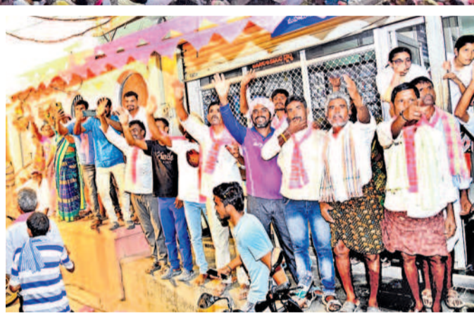
కేసీఆర్ కు అభివాదం చేస్తున్న ప్రజలు