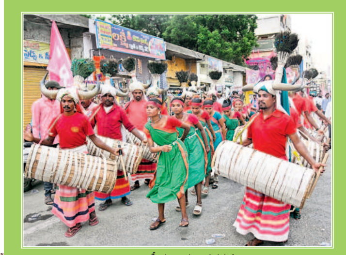
అదివాసీ కళాకారుల ప్రదర్శన