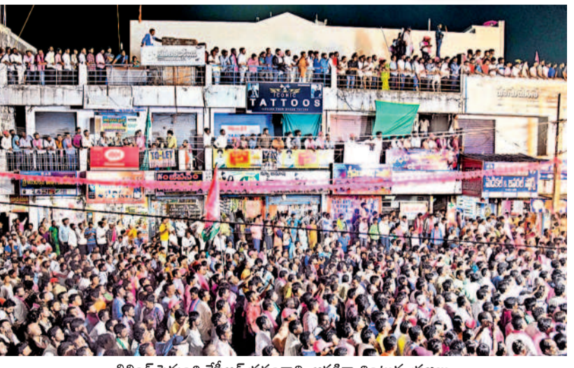
బిల్డింగ్ పైనంది కేసీఆర్ ప్రసంగాన్ని ఆసక్తిగా వింటున్న ప్రజలు

ప్రయాణం ఒక్కటి ఇచ్చి ఆటో కార్మికుల పాట్ల కొట్టిందని, ఒక పథకం అమలు చేసే ముందు ముందే తెలుసుకోవాలని ప్రజలకు పథకాలు ప్రవేశపెట్టినప్పుడు ఇంకో వర్గాన్ని దెబ్బతీసింది ఉండొద్దన్నారు. కాంగ్రెస్ ప్రభుత్వంలో కంటే ఉంటున్నదా? బోర్లలో నీళ్లు ఉన్నాయా? వడ్లకు బోసేన ఇచ్చారా? మహిళలకు రూ. 2500 చొప్పున ఇస్తామని ఇచ్చారా? ఏదీ అమలు కాలేదన్నారు. ఈ కాంగ్రెస్ కు ఓటు వేస్తే పథకాలు ఇయ్యకున్నా ఏమీ కాదని నిర్ణయంగా వ్యవహరిస్తారని, పథకాలు కావాలన్నా... జిల్లా మీకు ఉండాలన్నా మూలోత్ కవితను అత్యధిక మెజార్టీతో గెలిపించాలని కోరారు. ఖమ్మం, మహబూబాబాద్, డోర్లకల్, నర్సంపేట ప్రాంతాల్లో తాగునీటికి బదులు మురికినీళ్లు వస్తున్నాయని, నాలుగైదు నెలల్లోనే మిషన్ భగీరథ నీళ్లు ఎటువైపున ప్రసారించారు. ఈ ప్రాంతంలో గిరిజనులు ఎక్కువగా ఉన్నారు, గిరిజనుల కోసం బంజారా భవన్ కట్టించామని, పది శాతం రిజర్వేషన్ పెంచామని, తండాను గ్రామపంచాయతీలు చేశామని, ఇన్ని చేసిన బీఆర్ఎస్ ప్రాంతం గెలిపించాలని కోరారు. తన ప్రాంతం ఉన్నంతవరకు తెలంగాణ ప్రాంతానికి అన్యాయం జరగదని, జరగనియనని స్పష్టంచేశారు. కవిత బ్రహ్మాండంగా పనిచేస్తుందని, మచ్చలేని నాయకురాలని, పోవసాని అవకాశం ఇస్తే బద్దేళ్లు నిన్నూ