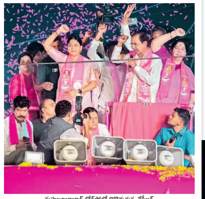
మహబూబాబాద్ రోడ్ షోలో జైకొడుతున్న కేసీఆర్, బిత్తెలం అభ్యర్థి మూలోత్ కవిత, ఎమ్మెల్సీ సత్యవతి