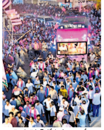
ఇల్లెందు బైపాస్ రోడ్డు నుంచి రావాలిగా వస్తున్న బీఆర్ఎస్ అధినేత కేసీఆర్

మహబూబాబాద్, మే 1 (నమస్తే తెలంగాణ) : బీఆర్ఎస్ అధినేత కేసీఆర్ రోడ్ షోకు జనం ప్రభంజనమై కదిలివచ్చారు. నలుదిక్కుల వరం గల్, ములుగు, భద్రాద్రి కొత్తగూడెం, మహబూబాబాద్ జిల్లా (జిల్లా) నుంచి వీరులపట్టుల్లోంచి బారులు తీరడంతో కార్యక్రమం విజృంభించి అన్ని ప్రాంతాల నుంచి దండూలా రావడంతో మహబూబాబాద్ పట్టణం జనసంద్రమైంది. బస్సుయాత్ర జిల్లాలో ప్రవేశించింది మొదలు అడుగుడుగునా సీరాజునం పలికారు. డప్పుప పుక్క సడను సెత్తిన బతుకమ్మలు, బోనాలతో ఎదురే ఘన స్వాగతం పలికారు. భారీ కటౌట్లు, గులాబీ తోరణాలతో మానుకోట ప్రాంతమంతా గులాబీమయమైంది. కేసీఆర్ బస్సు పైకి రాగానే రోడ్ షో ప్రాంగణంతా 'కేసీఆర్.. కేసీఆర్.. సీఎం సీఎం' అంటూ నినాదాలతో గెలిపిస్తారని ఆశిస్తున్నా. మీ వారం సాయంత్రం కొత్తగూడెం నుంచి బయల్దేరి మహబూబాబాద్ పట్టణం నుంచి బయల్దేరి పత్ర ముందు నుంచి ఇందిరాగాంధీ సెంటర్ వరకు చేరుకున్నారు. కేసీఆర్ తన ప్రసంగంలో మానుకోట అని ప్రస్తావించినప్పుడల్లా ప్రజల