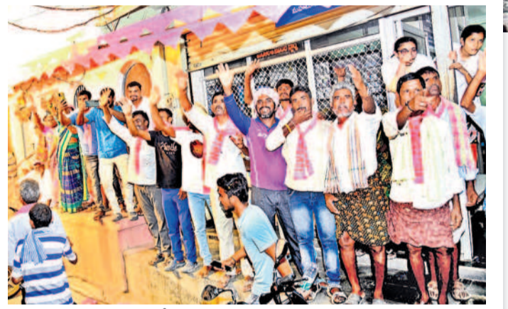
కేసీఆర్ కు అభివాదం చేస్తున్న ప్రజలు