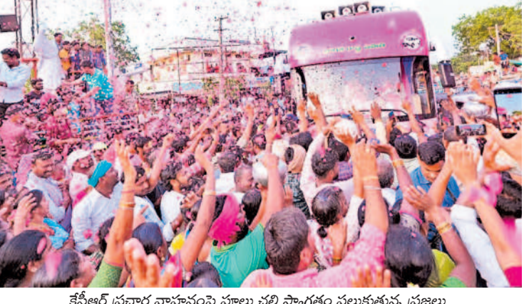
కేసీఆర్ ప్రవార వాహనంపై పూలు చల్లి స్వాగతం పలుకుతున్న ప్రజలు