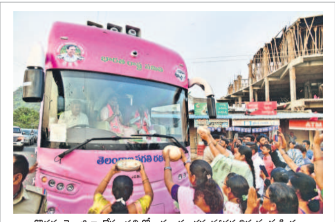
కొత్తగూడెం జిల్లా టేకులపల్లిలో బస్సుయాత్రకు హాజరువున్న మహిళలు