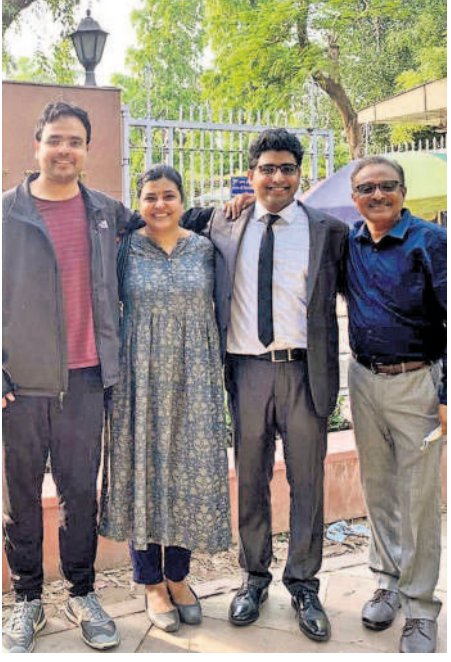
మిగతా 6వ పేజీలో..

ఎఎస్ (డిఫెన్స్ అకౌంట్స్)లో ఆఫీసర్ గా సర్వీస్ జాబ్ వచ్చింది. ప్రస్తుతం ఫరీదాబాద్ లోని ఏజేఎన్ ఐఎఫ్ ఎం లో శిక్షణలో ఉన్నాను. ఈసారి 196వ ర్యాంక్ సాధించాను. ప్రీవరేషన్.. నాలుగు బ్రాడ్ థింగ్స్ పెట్టుకున్నాను. వాటిలో మొదటి పిల్లర్.. స్టాటిక్ పోర్షన్ అంటే జాగ్రఫీ, హిస్టరీ, ఎకనమీ, పాలిట్, ఎన్ వీరాన్ మెంటల్ సైన్స్ తదితరాలు. చిన్నప్పటి నుంచి చదివినవి కావడంతో ఆ అంశాల్లో బాగా స్ట్రాంగ్ గా ఉన్నాను. రెండో పిల్లర్ గా టెస్ట్ పేపర్స్ రాశాను. వేర్వేరు ఇన్ స్టిట్యూట్స్ టెస్ట్ పేపర్స్ రాయాలి. దీనివల్ల చదివిన అంశాలను టెస్ట్ చేసుకోవడం జరుగుతుంది. మూడో పిల్లర్ వచ్చేసి కరెంట్ అఫైర్స్. దీనికోసం న్యూస్ పేపర్స్ తోపాటు విజన్ పీటీ 365 మ్యాగజైన్ చదివాను. సివిల్స్ ప్రీవరేషన్ వారు మార్కెట్ లో డొరికే ప్రామాణిక కరెంట్ అఫైర్స్ మ్యాగజైన్స్ ప్రీవేర్ కావాలి.