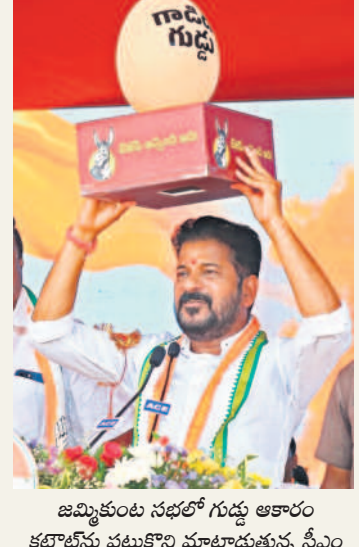
జమ్మి కుంట సభల్లో గుడ్డు ఆకారం కటాక్షీను మాట్లాడుతున్న సీఎం