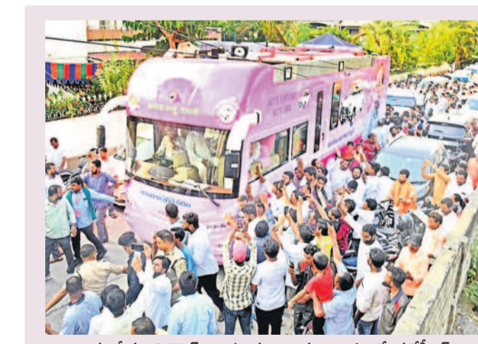
మాజీ మంత్రి కె.ఎస్.ఎం. నుంచి ఖమ్మం బయలుదేరిన కేసీఆర్

హనుమకొండ నుంచి ఖమ్మం రోడ్ షోకు.. హనుమకొండ, ఏప్రిల్ 29 : హనుమకొండ హనుమకొండలోని మాజీ మంత్రి కె.ఎస్.ఎం. నుంచి ఖమ్మం బయలుదేరిన కేసీఆర్ సోమవారం సాయంత్రం 4.40 గంటలకు ఖమ్మం బయల్దేరారు. ఈ సందర్భంగా ఉమ్మడి వరంగల్ జిల్లా నేతలు ఆయన కలిశారు. బస్సుయాత్రలో ఖమ్మం వెళ్తున్న కేసీఆర్ కు బీఆర్ఎస్ నాయకులు, స్థానిక ప్రజలు, అభిమానులు జైకొట్టగా, వారికి అభివాదం చేస్తూ ముందుకుసాగారు.