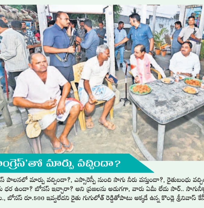
'కాంగ్రెస్' తో మార్పు వచ్చిందా? అని అడిగారు. కాంగ్రెస్ వచ్చినా మార్పు వచ్చిందా? అని అడిగారు. కాంగ్రెస్ వచ్చినా మార్పు వచ్చిందా? అని అడిగారు.

జననేతకు ఘన స్వాగతం పెద్దవంగర(తారూరు)/నర్సింహాలపేట/మరిపెడ, ఏప్రిల్ 29 : పార్లమెంట్ ఎన్నికల ప్రచారంలో భాగంగా ఖమ్మం జిల్లాకు వెళ్తున్న బీఆర్ఎస్ అధినేత కేసీఆర్ బస్సుయాత్ర సోమవారం సాయంత్రం తారూరు చేరగా జనం, బీఆర్ఎస్ పార్టీ శ్రేణులు ఘన స్వాగతం పలికారు. పాలకేంద్రం నుంచి బస్టాండ్ చౌరస్తా వద్ద వరంగల్-ఖమ్మం ప్రధాన రహదారిపై పెద్దఎత్తున కేసీఆర్ బస్సులో నుంచే కేసీఆర్ ప్రజలు, పార్టీ శ్రేణులకు అభివాదం చేశారు. జై తెలంగాణ.. జై జై తెలంగాణ.. అమర వీరులకు జోహార్లు అంటూ నినాదాలు చేశారు.