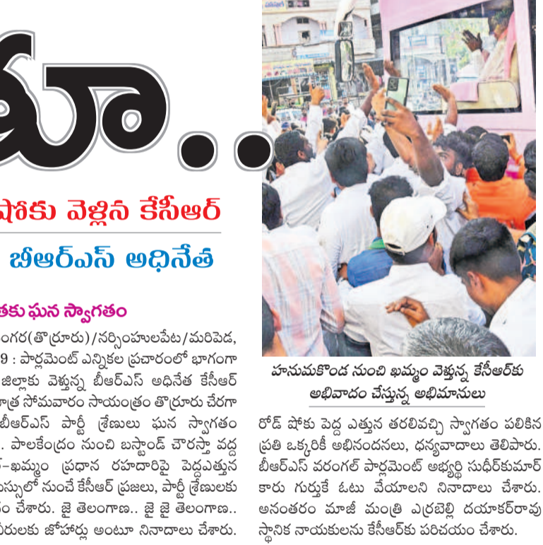
హనుమకొండ నుంచి ఖమ్మం వెళ్తున్న కేసీఆర్ కు అభిమానం చేస్తున్న అభిమానులు

కేసీఆర్ ఖమ్మం రోడ్ షోకు వెళ్తుండగా తారూరులో భారీగా తరలివచ్చి స్వాగతం పలుకుతున్న ప్రజలు అభిమాన నేతను చూసేందుకు కదిలివచ్చిన జనం సిస్టీలు, ఫోటోలు, కరచాలనాలతో మురిసిన చిన్నాపెద్దా.. యోగక్షేమాలు తెలుసుకొని పిమ్మిగా విన్న కేసీఆర్ సాగు, తాగునీటికి గోస పడుతున్నామన్న రైతులు, మహిళలు మంచిరోజులు వస్తాయి.. బీఆర్ఎస్ కు ఓటిస్ వారికి బుద్ధి చెప్పందని పిలుపు