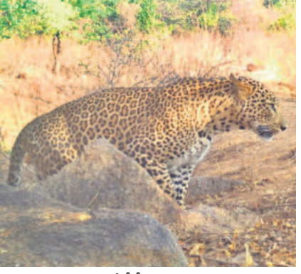
గంగాం ఫార్వెస్ట్ లో సీసీ కెమెరాకు చిక్కిన చిరుత

బిజినేపల్లి, ఏప్రిల్ 29 : మండలంలోని గంగాం, లట్టుపల్లి, మవయ్యాపల్లిని ఆనుకొని ఉన్న అడవిలో చిరుతలు సంపదీస్తున్నాయని పట్టుబట్టారు గ్రామాల ప్రజలు భయాందోళనకు గురవుతున్నారు. దీంతో అటవీశాఖ అధికారులు ఇటీవల అడవిలో సీసీ కెమెరా లు అమర్చారు. కాగా గంగాం అటవీ ప్రాంతంలోని నేరేరుడుపల్లి సమీపంలో, సోలార్ అధికారంలోకి వచ్చిన నేరేరుడు తాగుతూ మూడు చిరుతలు కెమెరాకు చిక్కాయి. నీటి కంటల వద్ద సాంబారులు ఆనే అడవి జంతువులు కూడా కనిపించాయి. అడవిలో చిరుతలు సంపదీస్తున్నాయని నిర్ధారణ కావడంతో ప్రజలు ఆందోళన చెందుతున్నారు. త్వరలోనే చిరుతలను పట్టుకుంటామని అటవీశాఖ అధికారులు బిలుతున్నారు.