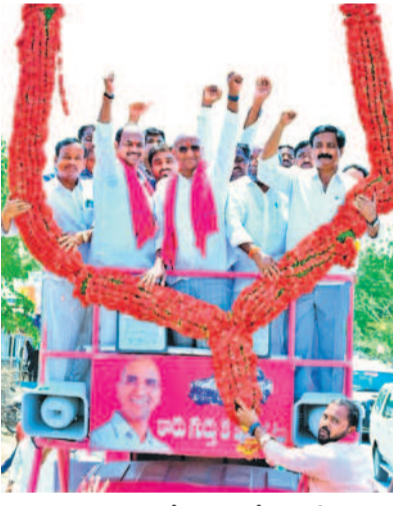
గద్వాల మండలం గోసుపాడులో ఎమ్మెల్యే బండ్ర, బీఆర్ఎస్ ఎంపీ అభ్యర్థి ఆర్ఎస్ ప్రవీణ్ కుమార్ తో కలిసి పార్లమెంట్ ఎన్నికల ప్రచారం నిర్వహిస్తున్న బీఆర్ఎస్ నాయకులు, కార్యకర్తలు