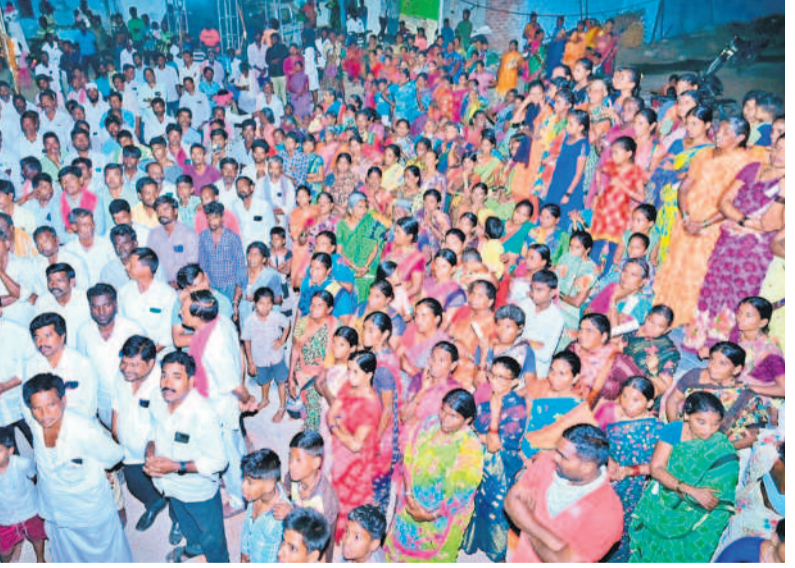
జోగుళాంబ గద్వాల జిల్లా మల్లకల్ మండల కేంద్రంలో జరిగిన ప్రచార కార్యక్రమానికి హాజరైన బీఆర్ఎస్ నాయకులు, కార్యకర్తలు, మహిళలు

టీసీలు, ఇంటియాజ్, కౌన్సిలర్లు, స్థానిక నాయకులు, కార్యకర్తలు పాల్గొన్నారు.