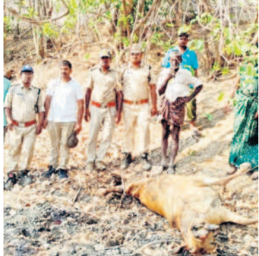
పులి దాడిలో మృతి చెందిన ఆవు కోబరూన్ని పరిశీలిస్తున్న ఫార్వెస్ట్ అధికారులు