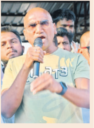
అని చూస్తున్నారు. ఎవరు హామీలు నెరవేర్చారు?.. ఎవరు విఫలమయ్యారు? ప్రజలు ఆలోచించుకోవాలి. అటు కేంద్రం, అటు రాష్ట్రం ప్రజలను ముంచడంలో ప్రావీణ్యాన్ని సంపాదించుకున్నాయి. నడిగడ్డ బిడ్డైన నన్ను పార్లమెంట్ కు పంపిస్తే మీ సమస్యలు పరిష్కరిస్తాను.

కేసీఆర్ హయాంలోనే అన్ని వర్గాలకు అట్టి చేకూరదన్న విషయాన్ని ప్రజలు గుర్తుంచుకోవాలి. గతంలో తాను గురుకులాల ముఖ్యకార్యదర్శిగా ఉన్నప్పుడు కేసీఆర్ సహకారంతో మార్కెట్లలో ప్రాంతాల్లోనూ పాఠశాలలను ఏర్పాటు చేశాం. విద్యార్థుల భవిష్యత్తును దృష్టిలో ఉంచుకొని కంప్యూటర్లను ఏర్పాటు చేసి విద్యను అందించిన ఘనత కేసీఆర్ కే దక్కుతుంది. రాష్ట్రం అన్ని రంగాల్లో అభివృద్ధి చెందడానికి పార్లమెంట్ లో బీఆర్ఎస్ ఎంపీలు ఉంటేనే సాధ్యమవుతుంది. హైదరాబాద్ కు ఎన్నో బట్టి కంపెనీలను తీసుకొచ్చి ఉద్యోగ అవకాశాలు కల్పించిన ఘనత బీఆర్ఎస్ ప్రభుత్వానికే దక్కుతుంది. పదేళ్ల నిజానికి, వంద రోజుల అబద్ధానికి జెర్నీ గుర్తున్న ఎన్నికల్లో బీఆర్ఎస్ అధినేత కేసీఆర్ ప్రజలను లొబడించాలి. రేపంకొద్ది వంద రోజుల్లోనే ఆరు గ్యారంటీలు అమలు చేస్తామని మోసపూరిత వాగ్దానాలు చేసి అధికారంలోకి వచ్చి ప్రజలను మోసం చేశారు. ఇప్పటివరకు పూర్తిస్థాయిలో రైతుబంధువేయలేదు. రుణమాఫీ పూటకో మాట మాట్లాడుతున్నారు. ఆగస్టు 15వరకు రుణమాఫీ చేస్తానని ఎక్కడ మీటింగ్ పెడితే అక్కడే దివ్యక్షేపి ఓట్లు వేస్తూ మరోసారి ప్రజలను మోసం చేయడానికి చూస్తున్నారు. ప్రజలు ఆ పార్టీని నమ్మి పరిస్థితి లేకపోవడంతోనే దివ్యక్షేపి ఓట్లు వేసి ఓట్లు పొందా