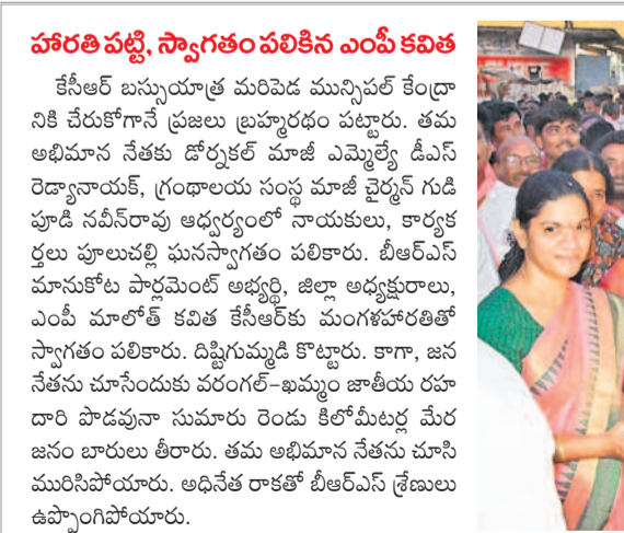
హారతి పట్టి, స్వాగతం పలికిన ఎంపీ కవిత