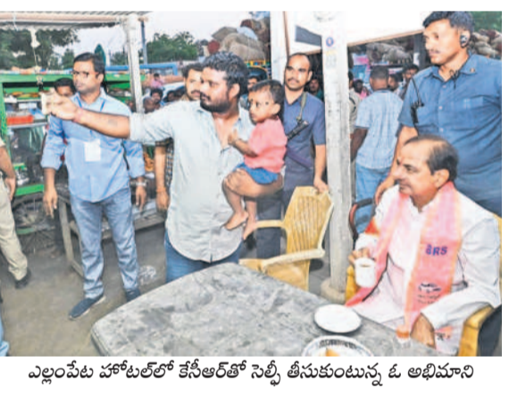
ఎల్లంపేట హోటల్లో కేసీఆర్తో సెట్టి తీసుకుంటున్న ఓ అభిమాని

జననేతకు ఘన స్వాగతం పెద్దవంగర(తొర్రూరు)/నర్సింహాలపేట/మరపడ, ఏప్రిల్ 29 : పార్లమెంట్ ఎన్నికల ప్రచారంలో భాగంగా ఖమ్మం జిల్లాకు వెళ్తున్న బీఆర్ఎస్ అధినేత కేసీఆర్ బస్సుయాత్ర సోమవారం సాయంత్రం తొర్రూరు చేరగా జనం, బీఆర్ఎస్ పార్టీ శ్రేణులు ఘన స్వాగతం పలికారు. పాలకేంద్రం నుంచి బస్పాండ్ చౌరస్తా వద్ద వరంగల్-ఖమ్మం ప్రధాన రహదారిపై పెద్దఎత్తున కేసీఆర్ బస్సులో నుంచే కేసీఆర్ ప్రజలు, పార్టీ శ్రేణులకు అభివాదం చేశారు. జై తెలంగాణ.. జై కేసీఆర్ అంటూ వీరులకు జోహార్లు నివాదాలు చేశారు.