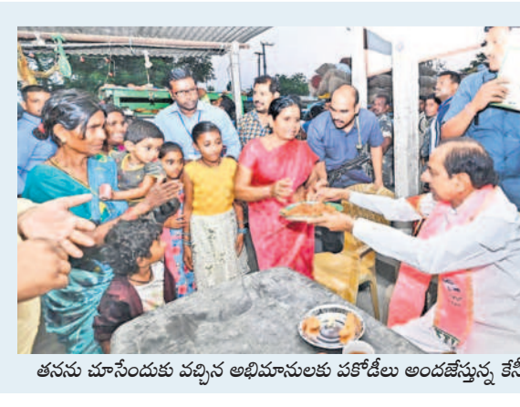
తనను చూసేందుకు వచ్చిన అభిమానులకు పకోడీలు అందజేస్తున్న కేసీఆర్