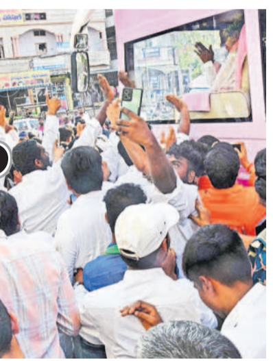
హనుమకొండ నుంచి ఖమ్మం వెళ్తున్న కేసీఆర్కు అభివాదం చేస్తున్న అభిమానులు