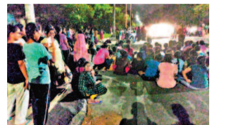
సీట్లకోత తీర్మానంపై రెండరోజుల క్రితం క్యాంపస్లో ఆందోళనకు దిగిన విద్యార్థులు

పదో తరగతి ఫలితాలు నేడే ఉదయం 11 గంటలకు రిజల్ట్ విడుదల >13