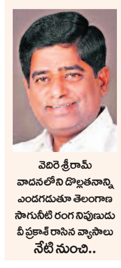
వెదిరె శ్రీరామ్ వాదనలోని డొబ్బతనాన్ని ఎందుకు తొలగించారు? శ్రీరామ్ గతంలో ప్రాజెక్టును ఆద్యుతమని ప్రశంసించారు.

వరదాయిని కాళేశ్వరం.. మాట మరిచిపోయిన శ్రీరామ్ ప్రాజెక్టుగా చూపించే తండ్రిలో ఇది భాగమేమో తెలవదు. అయితే కాళేశ్వరాన్ని తప్పింపలేదని దిగిన ఇదే వెదిరె శ్రీరామ్ గతంలో ఇదే కాళేశ్వరం ప్రాజెక్టును ఆద్యుతమని ప్రశంసించారు.