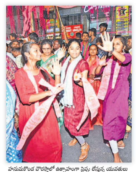
హనుమకొండ చౌరస్తాలో ఉత్సాహంగా స్టెప్పు లేస్తున్న యువతులు

5 | సోమవారం 29 ఏప్రిల్ 2024 | WARANGAL HANUMAKONDA