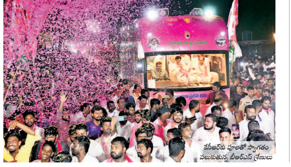
కేసీఆర్ కు పూలతో స్వాగతం పలుకుతున్న బీఆర్ఎస్ శ్రేణులు

హనుమకొండ చౌరస్తాలో బీఆర్ఎస్ అధినేత కేసీఆర్ రోడ్ షోకు హాజరైన అశేష జనవాహిని