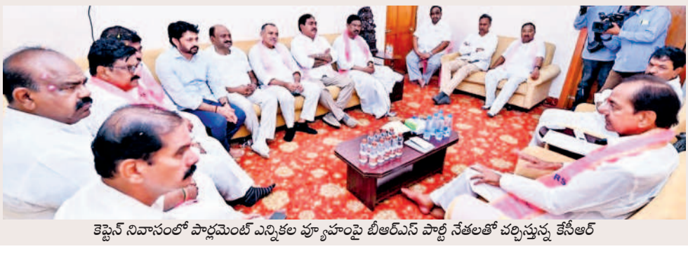
కెప్టెన్ నివాసంలో పార్లమెంట్ ఎన్నికల పూర్వంపై బీఆర్ఎస్ వాటి నేతలతో చర్చిస్తున్న కేసీఆర్