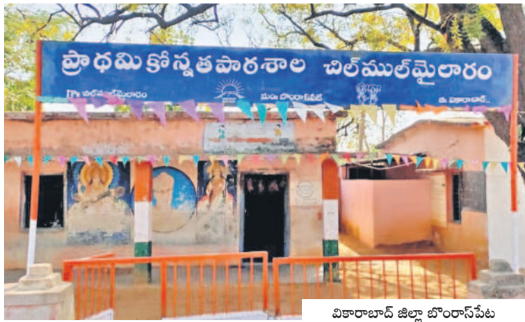
వికారాబాద్ జిల్లా బోంబాయిపేట మండలం చిల్డ్రన్ మైదానం గ్రామంలోని ప్రాథమిక కౌన్సిల్ పాఠశాల