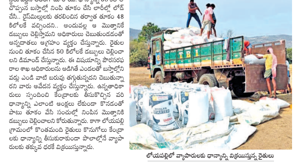
లోయపల్లిలో వ్యాపారులకు ధాన్యాన్ని విక్రమిస్తున్న రైతులు