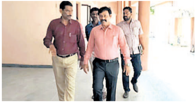
పరీక్ష కేంద్రాన్ని పరిశీలిస్తున్న అధికారులు

పెద్దపల్లిలోని పబ్లిక్ ప్రాథమిక పాఠశాలలో జరిగిన పరీక్షలకు ప్రాథమిక పాఠశాల అధికారులు పాఠశాలను పరిశీలించారు. పరీక్షల నిర్వహణకు అనుకూలంగా ఉందని తనిఖీ చేశారు. పరీక్షల నిర్వహణకు అనుకూలంగా ఉందని తనిఖీ చేశారు. పరీక్షల నిర్వహణకు అనుకూలంగా ఉందని తనిఖీ చేశారు.