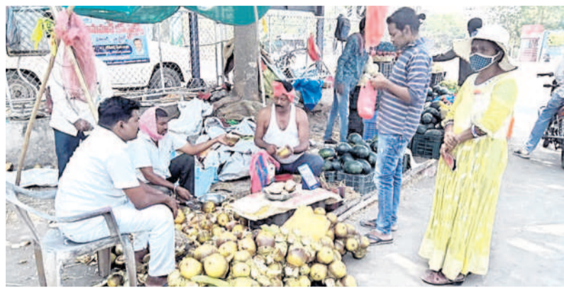
గోదావరిఖనిలో రోడ్ల పక్కన తాటి ముంజల విక్రయాలు

కోటిసీట్, ఏప్రిల్ 28: ఎండాకాలం వచ్చిందంటే చాలు.. త్వరగా నీరసించడం... వేడి వాతావరణానికి అలసిపోవడం... ముఖ్యంగా చిన్న చిన్న మొలకలు రావడం... విపరీతమైన చెమట సహజం. వీటి నుంచి ఉపశమనం పొందాలంటే తాటి ముంజలతోనే సరి. వేసవిలో గ్రామీణ ప్రాంతాల్లో లభించే తాటిముంజలు ఇప్పుడు నగరంలో ప్రధాన రహదారులపై కుప్పలుగా పోసి విక్రయిస్తున్నారు. గోదావరిఖని ప్రధాన జాతీయ రహదారికి దగ్గరలో రోడ్ల పక్కన వీటి విక్రయాలు ఉండడం మంచిది. తాటి ముంజలతోనే సరి. వేసవిలో ఏముంటుంది అని కొందరు నిర్లక్ష్యం చేస్తుంటారు. వాటి రహస్యం తెలిసిన వారు మాత్రం తప్పకుండా ఎండాకాలంలో తాటిముంజల రుచి చూస్తుంటారు. అలాంటి తాటిముంజలతో బోలెడన్ని లాభాలుంటాయి.