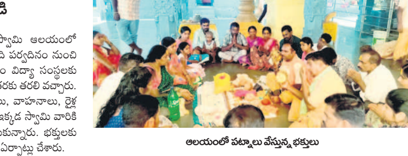
ఆలయంలో పట్టా వేస్తున్న భక్తులు

ఓదెల, ఏప్రిల్ 28: ఓదెల మల్లికార్జునస్వామి ఆలయంలో ఆదివారం భక్తులతో సందడి నెలకొంది. ఊడి పర్యటనం నుంచి మల్లన్న జాతర ప్రారంభం కావడం, ప్రస్తుతం విద్యా సంస్థలకు నెలపులు కావడంతో భక్తులు పెద్ద సంఖ్యలో జాతరకు తరలివచ్చారు. వివిధ దూర ప్రాంతాల నుంచి ప్రత్యేక బస్సులు, వాహనాలు, రైల్వే ద్వారా ఆలయానికి ఉదయాన్నే చేరుకున్నారు. ఇక్కడ స్వామిని పర్యాయనీ పట్టా వేసి, బోనాలతో మొక్కులు చెల్లించుకున్నారు. భక్తులకు ఇబ్బందులు కల్గకుండా ఆలయ సిబ్బంది తగిన ఏర్పాట్లు చేశారు.