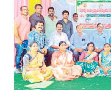
ధర్మారం : కొత్తూరు విద్యార్థుల పూర్వ విద్యార్థులు

పెంచుతాం, రూ. 2 లక్షల రుణమాఫీ చేస్తాం, రూ.500 బోనస్ ఇస్తాం, కల్యాణలక్ష్మి తులం బంగారం ఇస్తామని అడ్డగోలు వాగ్దానాలు చేసిన కాంగ్రెస్ నాయకులను తరిమికోట్లాలని, మండు దొండలో రైతుల పడుతున్న గోసను పట్టించుకోకూడదని ఆరోగ్యం కోసం గోసను తింటే మంచిది అని చెప్పారు. రైతులను ముంచిన కాంగ్రెస్ కు బుద్ధి చెప్పాలి అని కోరారు. రైతులను ముంచిన కాంగ్రెస్ కు బుద్ధి చెప్పాలి అని కోరారు.