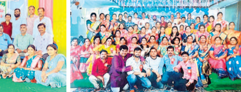
ఫర్లిజిల్ల సీట్ : రాజరాజేశ్వరి హైస్కూల్ పూర్వ విద్యార్థులు