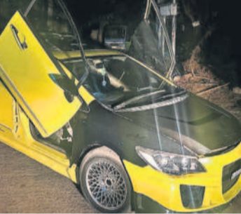
పోలీసులకు పట్టుబడిన కారు