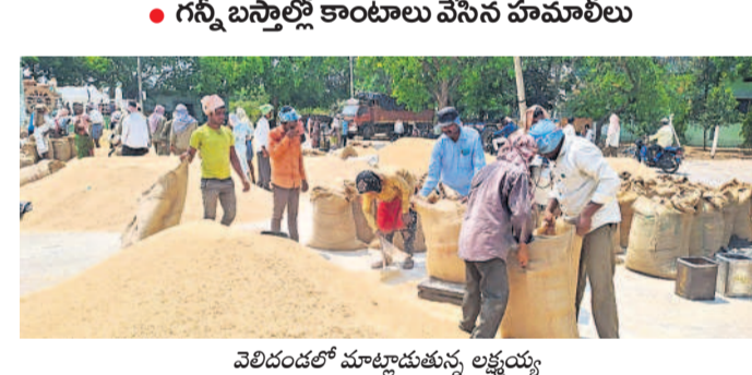
గన్న బస్తాల్లో కాంటాలు వేసిన హమాబీలు

బోడ్రాయిబజార్, ఏప్రిల్ 27 : జిల్లా కేంద్రంలోని వ్యవసాయ మార్కెట్లో ధాన్యం కాంటాలు యధావిధిగా కొనసాగుతున్నాయి. నాన్వెన్యూల పరిష్కారం చేయాలి. కాంటాలు పూర్తి చేసి శుభ్రవారం మెరుపు సమ్మెకు దిగి కాంటాలు నిలిపివేసిన విషయం తెలిసిందే. అధికారులు స్పందించి ఖరీదుదారులతో మాట్లాడారు. జరుగుతున్నట్లు ఆయన పేర్కొన్నారు.