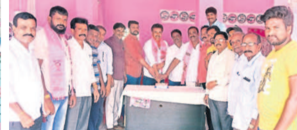
నేరేడుపల్లి : నేరేడుపల్లిలో పార్టీ ఆవిర్భావ వేడుకలను నిర్వహిస్తున్న బీఆర్ఎస్ నాయకులు