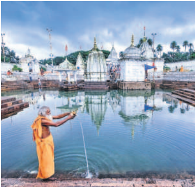
లెన్నో ఇక్కడ కనిపిస్తాయి. జీవితంలో చూసి తీరాల్సిన పుణ్యక్షేత్రాలంటూ ఉంటే, వాటిలో అమర్ కంటక్ ఒకటని ఒప్పుకొని తీరుతారు భక్తులు.

దట్టమైన అరణ్యాలలో కనిపించే అరుదైన పుణ్యక్షేత్రం అమర్ కంటక్. నర్మద జన్మస్థానం. అటు వింధ్య, ఇటు సాత్పుర పర్వత శ్రేణుల కూడలి. వేయి మీటర్లకు పైగా ఎత్తున్న ఈ ప్రదేశంలో నది ఉద్భవించే చోటి నర్మదా మాత గుడి ఉంది. ఓవైపు ప్రకృతి అందాలు, మరోవైపు అబ్బురపరిచే శిల్పకళ... ఈ స్థలాన్ని చూసి తీరాల్సిన పుణ్యక్షేత్రంగా మార్చేసాయి. దాదాపు 600కు పైగా అరుదైన జీవజాతులు ఇక్కడ ఉన్నాయని అంచనా. కాశిదాసు, కబీర్ లాంటి మహా మహులు ఇష్టపడిన ప్రదేశమిది. వెయ్యేండ్ల క్రితం కామదేవ రాజు నిర్మించిన త్రిమూఖి ఆలయం, జైన మందిరం, శంకరాచార్య ఆశ్రమం... లాంటి కట్టడా