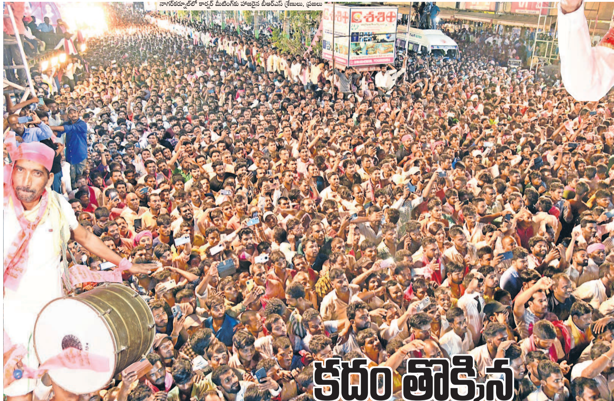
నాగర్ కర్నూల్ లో కార్నర్ మీటింగుకు హాజరైన బీఆర్ఎస్ శ్రేణులు, ప్రజలు

జనవాహినిని తలపించిన కేసీఆర్ బస్సుయాత్ర మాడు కిలోమీటర్ల పొడవునా ఘన స్వాగతం డప్పులు, పేర్ బ్యాండ్, డీజేలతో హోరెత్తించిన శ్రేణులు