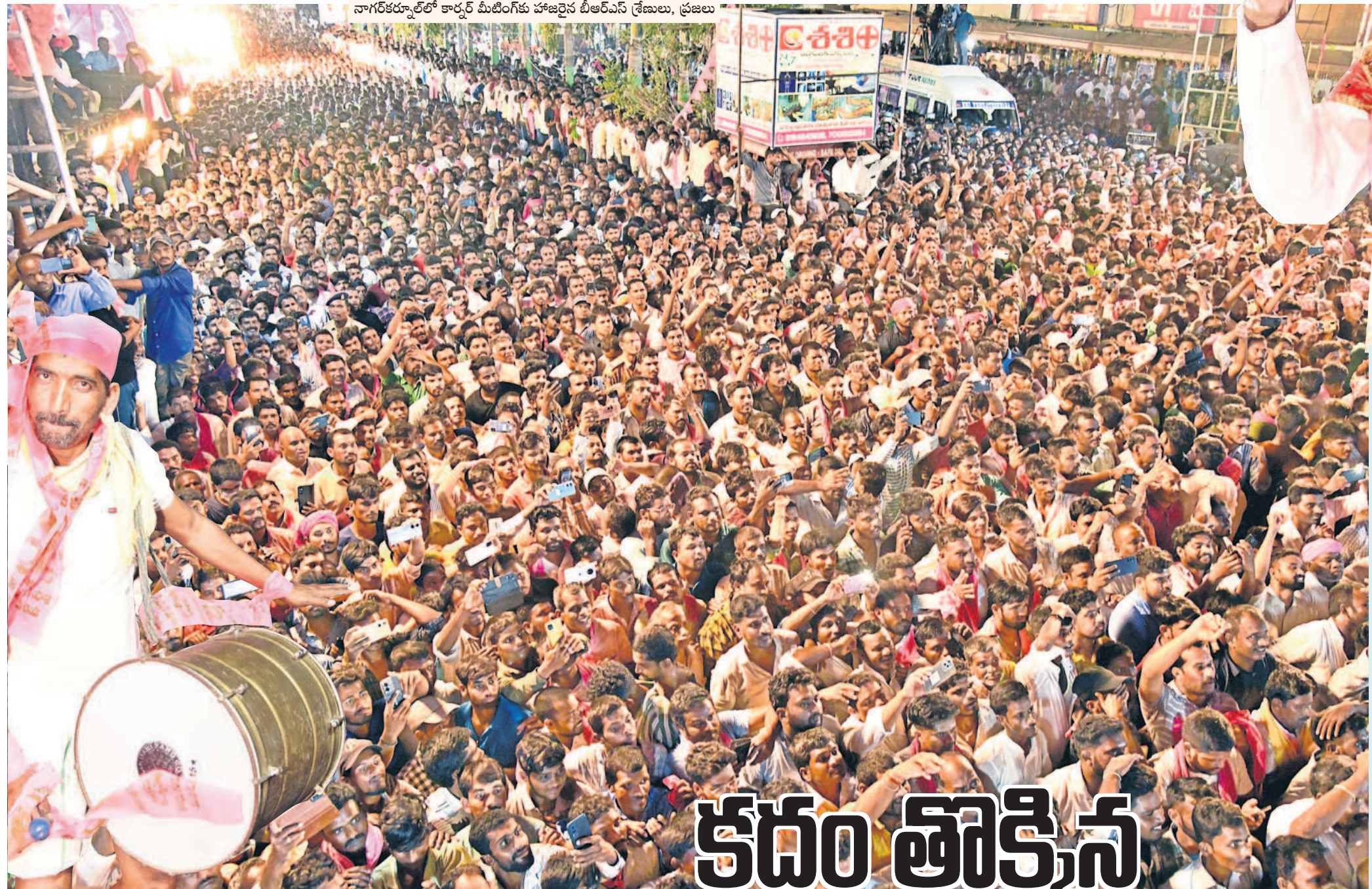
నాగర్ కర్నూల్ లో కార్నర్ మీటింగుకు హాజరైన బీఆర్ఎస్ శ్రేణులు, ప్రజలు

జనవాహినీ తలపించిన కేసీఆర్ బస్సుయాత్ర మాడు కిలోమీటర్ల పొడవునా ఘన స్వాగతం డప్పులు, పేర్ బ్యాండ్, డీజేలతో హోరెత్తించిన శ్రేణులు