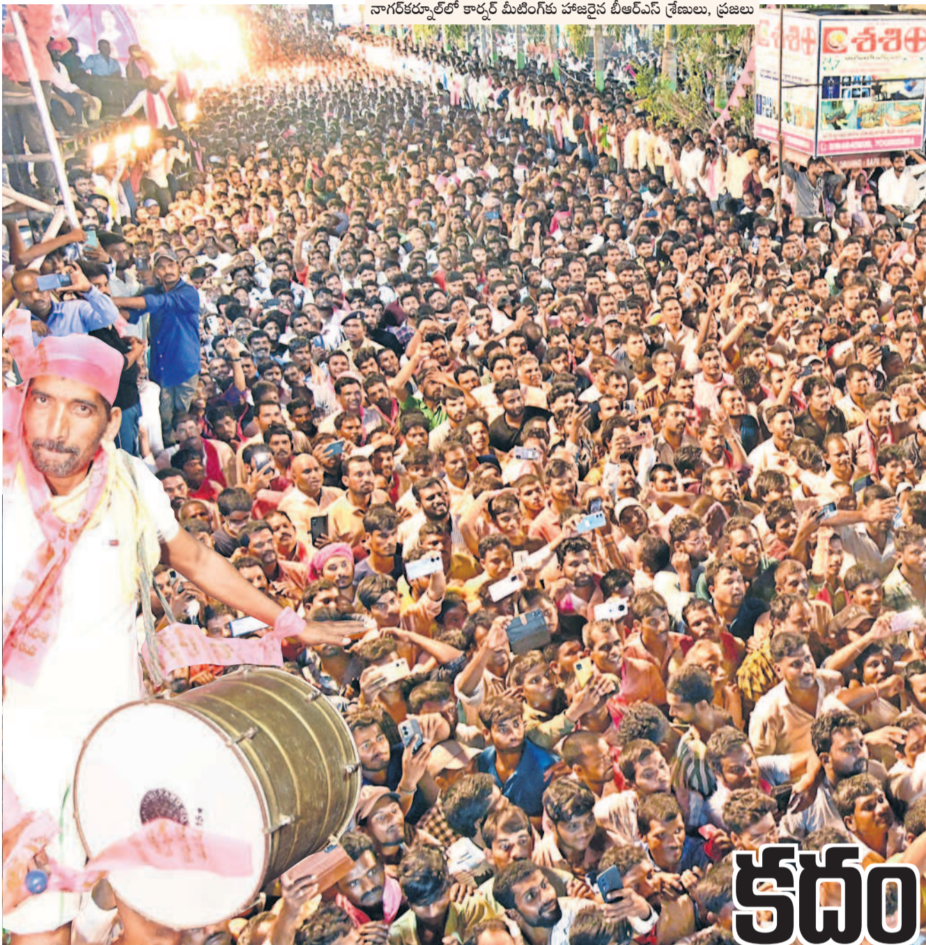
నాగర్ కర్నూల్ లో కార్నర్ మీటింగుకు హాజరైన బీఆర్ఎస్ శ్రేణులు, ప్రజలు

జనవాహినిని తలపించిన కేసీఆర్ బస్సుయాత్ర • మూడు కిలోమీటర్ల పొడవునా ఘన స్వాగతం • డప్పులు, పేర్ బ్యాండ్, డీజేలతో హోరెత్తించిన శ్రేణులు