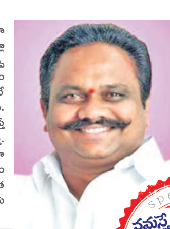
అనవసరంగా ఓడగొట్టుకున్నామనే భావన విసిగిస్తున్నది. బీఆర్ఎస్ ప్రభుత్వం రాజహస్తంతో ఓడగొట్టుకున్నామనే భావన విసిగిస్తున్నది. బీఆర్ఎస్ ప్రభుత్వం రాజహస్తంతో ఓడగొట్టుకున్నామనే భావన విసిగిస్తున్నది.

మీరు గెలిస్తే ఏమేం చేస్తారు? ఇంతకుముందు పనిచేసిన ఎంపీలు జహీరాబాద్ సమస్యలపై ఏమీ చేయలేదు. మోసాల ద్వారా వారి వ్యాపారాలను పెంచుకున్నారు తప్ప ఎలాంటి అభివృద్ధి పనులూ చేయలేదు. తెలంగాణ మేలు కోరి బీఆర్ఎస్ ఎంపీలు ఉంటేనే రాష్ట్రానికి దక్కాలని హామీలు దిక్కుతాయి. ప్రజలు అశ్రద్ధించి నమ్మి పాదమెంటుకు వచ్చిన బీదర్ టు బోధన్ రైల్వే లైన్ ను పూర్తి చేయిస్తా. జహీరాబాద్ నియోజకవర్గంలోని ప్రతి మండలానికి జాతీయ రహదారిలో కనెక్టివిటీ పెంచడం నా ప్రధాన అజెండా. ఎంపీగా గెలిచాక సొంత నిధులతో పెద్ద సంఖ్యలో జాబ్ మేళాలు పెట్టాలని దివ్యగులుకు ఉద్యోగావకాశాలు కల్పిస్తా.