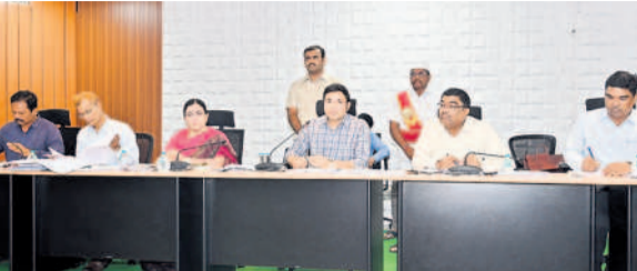
సమావేశంలో మాట్లాడుతున్న భూపాలవల్లి జిల్లా కలెక్టర్ భవేశ్ మిశ్రా

కృష్ణ కాలనీ, ఏప్రిల్ 26: ఉపాధి హామీ పనులకు కూలీలు పెద్ద సంఖ్యలో వచ్చేలా చర్యలు చేపట్టాలని కలెక్టర్ భవేశ్ మిశ్రా అన్నారు. ఉపాధి హామీ పనులకు పనులకు పెద్ద సంఖ్యలో కూలీలను తరలించడం, తాగునీటి సరఫరా, అమ్మ అడవు పాఠశాలలో మౌలిక సదుపాయాల కల్పన పనులు, గ్రామ పంచాయతీలో చేపట్టిన పనులు తదితర అంశాలపై సంబంధిత అధికారులతో శుక్రవారం ఐడీ ఓసీ కార్యాలయ సమావేశ హాల్లో సమావేశం నిర్వహించారు. కలెక్టర్ మాట్లాడుతూ గ్రామాల్లో అర్హులందరికీ జాబ్ కార్డులు జారీ చేయాలని ఎంపీడీవోలకు సూచించారు. తక్కువ మంది కూలీలు వస్తున్న గ్రామాల్లో అవగాహన కల్పించాలన్నారు. ఒక్కో గ్రామ పంచాయతీ పరిధిలో 200 మందికి తగ్గకుండా కూలీలు హాజరయ్యేలా చర్యలు తీసుకున్నారన్నారు. వేసవి దృష్ట్యా ఉపాధి హామీ పనులు జరిగే ప్రదేశాల్లో సీడ్ కోసం షేడ్ నెట్లు, తాగునీరు, ఓఆర్ఎస్ ప్యాకెట్లు, అత్యవసర మందులు అందుబాటులో ఉంచాలన్నారు. అమ్మ అడవు పాఠశాల