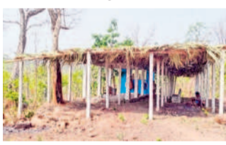
ఆలయం ఎదుట వేసిన పందిరి