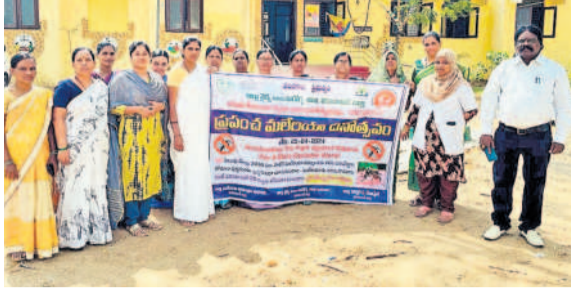
కులకచర్ల మండల కేంద్రంలో..

కొడంగల్, ఏప్రిల్ 25: మలేరియాను తరిమి కొడదామని ఈ వ్యాధి నివారణకు తీసుకోవాల్సిన జాగ్రత్తలపై ఆశ కార్యకర్తలు అవగాహన కల్పించారు. ప్రపంచ మలేరియా నివారణ దినోత్సవాన్ని పురస్కరించుకొని గురువారం పట్టణంలో ర్యాలీ నిర్వహించారు. అనంతరం అంబేద్కర్ కూడలిలో ఏర్పాటు చేసిన సమావేశంలో మలేరియా నివారణకు తీసుకోవాల్సిన జాగ్రత్తలను వివరించారు. దోషు కుట్టుకుండా జాగ్రత్తలు తీసుకోవాలన్నారు. ఇంటి పరిసరాలను పరిశుభ్రం ఉంచుకోవాలని సూచించారు. దోషు కాటుతో మలేరియా, ప్లేటెలియాతో పాటు డెంగ్ వచ్చే అవకాశం ఉందన్నారు. వేసకాంలో అరబయట నిద్రించే వారు