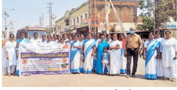
కొడంగల్ అంబేద్కర్ కూడలిలో ర్యాలీ..

• ఊరూరా జాతీయ మలేరియా నివారణ దినోత్సవ ర్యాలీలు • వ్యాధి నివారణపై అవగాహన కల్పించిన ఆశ కార్యకర్తలు