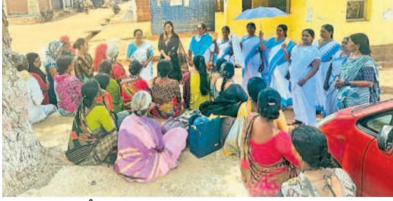
మర్చల్లో గ్రామస్థులకు అవగాహన కల్పిస్తున్న వైద్యసేబుంది