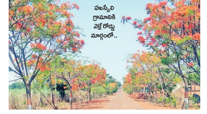
హుస్సేన్ లిల్ గ్రామానికి చెట్లతో సజీవ వరదానం పూలు

న్యాలేకల్, ఏప్రిల్ 25: తోరణం కట్టినట్లు దారి పాడవునా ఉన్న గుల్మాలతో పచ్చని చెట్ల వరుస, అరణ్య వనం పూల వాహనదారులను కట్టిపడేస్తున్నాయి. కేసీఆర్ ప్రభుత్వ పాలనలో ప్రతిష్టాత్మకంగా చేపట్టిన హరితహారంలో భాగంగా నాటిన గుల్మాలతో చెట్ల ప్రయాణాలకు అడ్డం దారులను కట్టిపడేస్తున్నాయి. భానుడి భగవంతుని నుంచి నీడనిస్తూ, చల్లదాన్ని అందిస్తున్నాయి. మండలంలోని హుస్సేన్ లిల్-గుంజోళ్ళి గ్రామాలలో పాటు ముగి గ్రామాలలోని అల్లూరుగం-మెట్లకుంభ ప్రధాన రోడ్డు మార్గంలో అరవైపులా గుల్మాలతో చెట్ల వరుసను ఏర్పాటు చేస్తున్నారు. ఆయా రోడ్డు మార్గంలో ప్రయాణించే వాహనదారులకు చల్లదాన్ని అనుభూతిని కలిగిస్తున్నాయి.