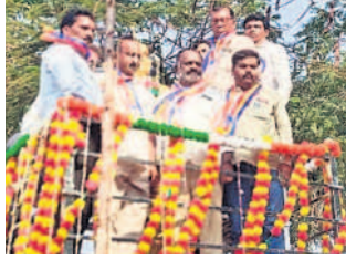
హుస్సేన్ లిల్లో అంబేద్కర్ విగ్రహాన్ని అవిష్కరిస్తున్న నాయకులు