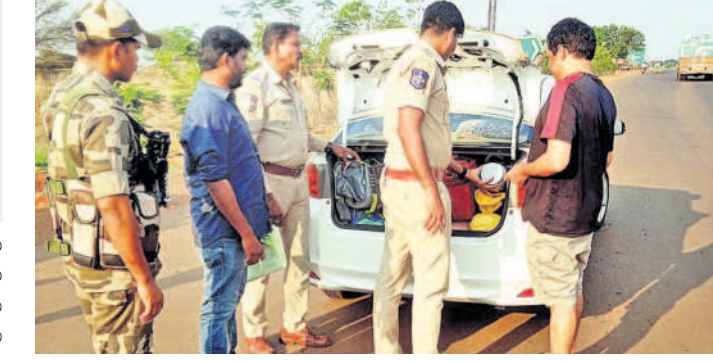
మాడ్డి చెక్ పోస్ట్ వద్ద వాహనాలను తనిఖీ చేస్తున్న బీరాగపల్లి పోలీసులు

న్యాలేకల్, ఏప్రిల్ 25: లోక్ సభ ఎన్నికల ప్రశాంత వాతావరణంలో జరిగేలా పోలీసులు అధికారులు పకడ్బందీ చర్యలు తీసుకుంటున్నారు. మండలంలోని హుస్సేన్ లిల్, మల్లి గ్రామ శివారులోని కర్ణాటక-తెలంగాణ సరిహద్దు ప్రాంతంలో అంతర్ రాష్ట్ర చెక్ పోస్టులను ఏర్పాటు చేశారు. నిఘా ఇతర రాష్ట్రాల నుంచి జిల్లాలోని వచ్చే వాహనాన్ని క్షణంగా తనిఖీ చేస్తున్నారు. ఎటువంటి రసీదులు, పత్రాలు లేకుండా ఆయా రాష్ట్రాల నుంచి తెలంగాణ లోకి తరలిస్తున్న మద్యం, సగం ముమ్మర సీజ్ చేస్తున్నారు.