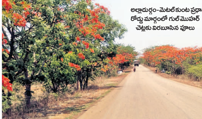
అల్లూరుగం-మెట్లకుంభ ప్రధాన రోడ్డు మార్గంలో గుల్మాలతో సజీవ వరదానం పూలు