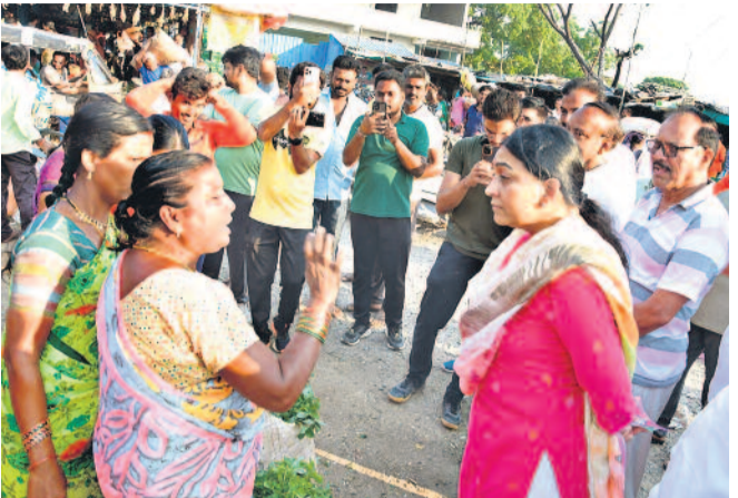
మహబూబాబాద్ మార్కెట్లో జాలగారులు అమ్మే మహిళ తో మాట్లాడుతున్న ఎంపీ కవిత