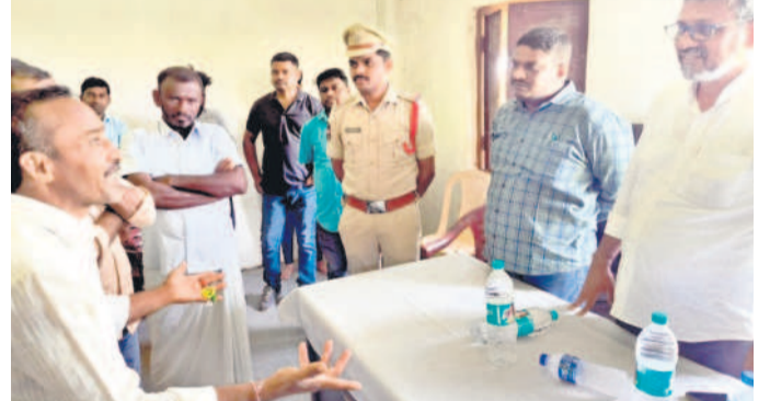
అధికారులతో మాట్లాడుతున్న గ్రామస్తులు

కోటపల్లి, ఏప్రిల్ 25 : 'మా సమస్య పరిష్కారం అయ్యే వరకు ఓటు వేసేది లేదు.' అంటూ చుట్టూ పదిలం వేసుకుంటున్నారన్నారు. ఏమీ సమస్యలు తీర్చివార లేరు. ఇక ఓటికే వడ్డను మా తరం కాదు. ఓట్లు నాడు షార్డం అయ్యే వరకు ఓటు వేసేది లేదు. రావడం. ఓటు వేసాక వెళ్ళడం. ఇదే అప్పు ఏండ్లు గడుస్తున్నా మమ్మల్ని పట్టించుకునే వారు లేరు. ఇప్పుడుంటున్న వడ్డను మాత్రం చేసి నా.. ఏం చెప్పిన మా ప్రధాన సమస్య