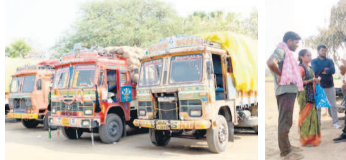
మంచిర్యాలలోని ఓ మిట్టలకు అందరికీ డింకా కోసం ఉన్న లారీలు

ప్రైవేటుకు అమ్ముకున్నాం.. గర్లుమెంట్ ధాన్యాన్ని కొనుగోలు చేయడంలో జాప్యం చేస్తున్నది. తెలు శాతం పేరిట మేము రోడ్డుపైన వడ్డను ఎండపెట్టాలి వస్తున్నది. మరేచెప్పే అలా వర్షాలు వస్తుండడంతో ఉన్న ధాన్యం తడిస్తే మొత్తాకే నష్టపోవాలి వస్తున్నదని ప్రైవేటు వ్యక్తులకు ధాన్యాన్ని అమ్ముకుంటున్నారు. ఇక్కడ అధికారులు, నాయకులు ఎవరవ బట్టించకోవడం లేదు. నాకు తెలిసిన రైతులు ఇద్దరు ముగ్గురు ఈ మధ్య అమ్ముకున్నారు. నేను కూడా బయట అమ్ముకుంటున్నా. తెలు శాతం 30 ఉన్నా కూడా ప్రైవేట్ వాళ్లు తీసుకెళ్ళిపోతున్నారని చెబుతున్నారు. కిర్లల్ (లే)లో ధాన్యం కొనుగోలు సెంటర్ ఉన్నప్పటికీ కొనుగోళ్లు మొదలుకాలేదు. సెంటర్ కు ఈ రోజు గన్నీ బ్యాలిగా వచ్చాయి. సామంతుల నుంచి కొనుగోళ్లు మొదలుపెడతామని చెబుతున్నది. మరి రేపటికే పైగా కొనుగోళ్లు స్టాప్ చేస్తే బాగుంటుంది.