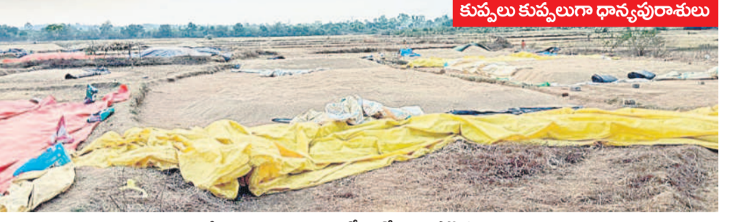
కుప్పలు కుప్పలుగా ధాన్యపురానులు

మంచిర్యాల, ఏప్రిల్ 25 (నమస్తే తెలంగాణ ప్రతినిధి) : ఉమ్మడి ఆదిలాబాద్ జిల్లావ్యాప్తంగా పలు చోట్ల ధాన్యం కొనుగోళ్లు మొదలు కాలేదు. రైతులు వడ్డను కల్లలకు తెచ్చి 20 రోజులు అవుతున్నా కొనుగోళ్లు జరగడం లేదు. దీంతో తప్పనిసరి పరిస్థితుల్లో వడ్డను ప్రైవేటు దళాలకు విక్రయిస్తున్నారు. ఉమ్మడి ఆదిలాబాద్ జిల్లాలో 508 ధాన్యం కొనుగోలు సెంటర్లకు 215 సెంటర్లలోనే ఇప్పుడు ధాన్యం కొంటున్నారు. మంచిర్యాల, నిర్మల్ జిల్లాల్లో తప్ప ఆసిఫాబాద్, ఆదిలాబాద్ లో ఇంకా కేంద్రాలు తెరచకోలేదు. ఆసిఫాబాద్ జిల్లాలో 35 సెంటర్లకు 15 సెంటర్లను అధికారులు స్టాప్ చేశారు. కానీ.. ఇప్పటి వరకు ధాన్యం కొనలేదు. మంచిర్యాల జిల్లాలో 282 సెంటర్లకు 92 కేంద్రాల్లో ధాన్యం కొంటున్నారు. నిర్మల్ జిల్లాలో 208 సెంటర్లకు కడం, ఖానా పూర్, ముర్తీ ప్రాంతాల్లో 125 సెంటర్లు తెరిచారు. కానీ.. వడ్డను మాత్రం 25 సెంటర్లకే పరిమితమై ఉంది. ఆదిలాబాద్ జిల్లాలో మూడు సెంటర్లకు ఇంకా మొదలు కాలేదు. సాధారణంగా మిగిలిన జిల్లాల్లో పోలిస్టే ఉమ్మడి ఆదిలాబాద్ జిల్లాల్లో కోతలు కొంచెం ఆలస్యం అవుతాయి. దీంతో ధాన్యం వచ్చాకే సెంటర్లు తెరుస్తామని అధికారులు చెబుతున్నారు. ఇక్కడ ఆసలు సమస్య వస్తుంది. రైతులు ధాన్యం తెచ్చి కేంద్రాల దగ్గర పోతాకే అధికారం కొనుగోళ్లు ఏర్పాటు చేస్తుండడంతో ఆలస్యం అవుతున్నది. మంచిర్యాల, నిర్మల్ జిల్లాల్లో కొన్ని సెంటర్లలో ఇదే పరిస్థితి కనిపిస్తున్నది. కాగా.. మంచిర్యాల జిల్లాలో గతంలో పోలిస్టే ఈ సారి కొన్ని సెంటర్లను తీసివేయడంతో రైతులు ఆందోళన చెందుతున్నారు. గతంలో సెంటర్ ఉన్న దగ్గర వడ్డను పోసుకుని కొనేవారి కొసం ఎదురు చూస్తున్నారు. కాగా.. చాలా కేంద్రాలకు గన్నీ సములు ఇప్పుడిప్పుడే చేరుతుంటున్నాయి.