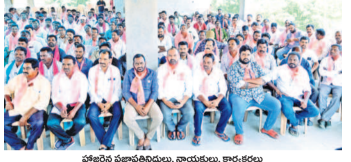
పాల్గొన్న ప్రజాప్రతినిధులు, నాయకులు, కార్యకర్తలు