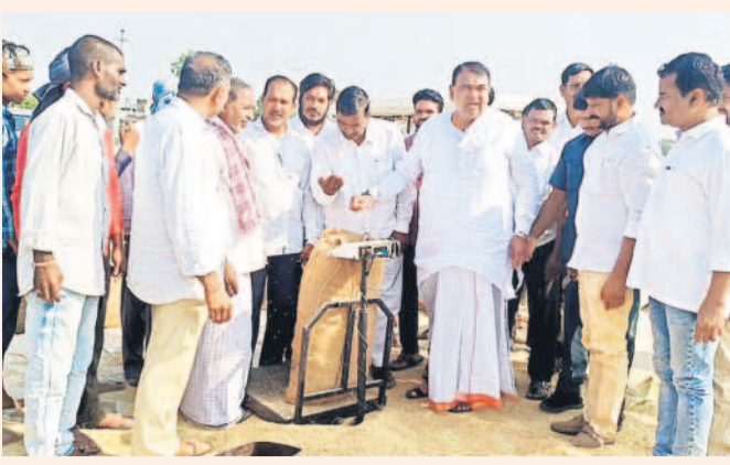
ధాన్యం కొనుగోలు కేంద్రం వద్ద రైతులతో మాట్లాడుతున్న పోచారం శ్రీనివాసరెడ్డి

ప్రభుత్వం కొనుగోలు కేంద్రాలను ప్రారంభించ లేదన్నారు. కాంటా జరిగి రోజులు గడుస్తున్నా రైతులకు డబ్బులు అందడం లేదంటూ ప్రభుత్వ తీరుపై అసహనం వ్యక్తం చేశారు. కొనుగోలు కేంద్రానికి పోచారం వచ్చినట్లు తెలుసుకున్న రైతులు ఒక్కసారిగా ఆయన వద్దకు చేరుకున్నారు. వారు పడుతున్న ఇబ్బందులను పోచారం దృష్టికి తీసుకెళ్లారు. అకాల వర్షాలకు నేలకొరవైన పంట విషయంలో ప్రభుత్వ స్పందన సరిగ్గా లేదని, కొనుగోలు కేంద్రాలను కూడా సరిగ్గా ఏర్పాటు చేయడంలేదని రైతులు ఈ సందర్భంగా ఆవేదన వ్యక్తం చేశారు. రైతులు ప్రభుత్వాన్ని నిలదీసి రోజులు చాలా దగ్గరలో ఉన్నాయని పోచారం హెచ్చరించారు.