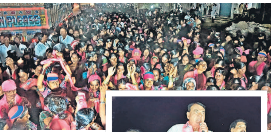
రోడ్ షోకు పెద్ద సంఖ్యలో హాజరైన గిరిజనులు