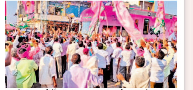
దేవరపల్లెలో కేసీఆర్ ను చూడడానికి వచ్చిన బీఆర్ఎస్ శ్రేణులు