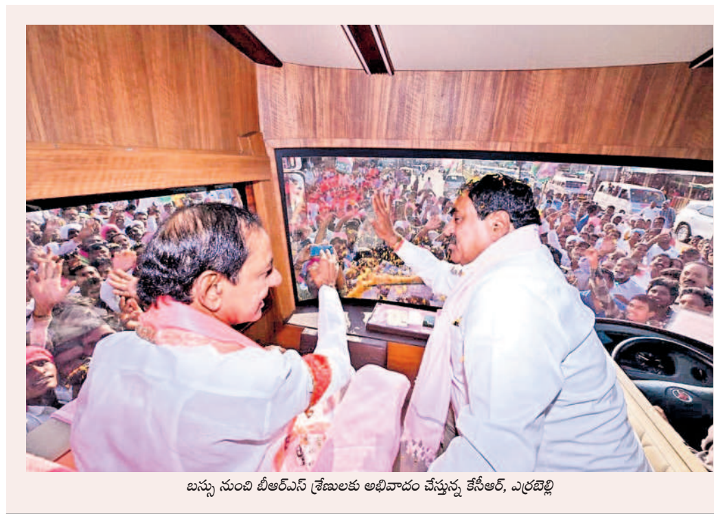
బస్సు నుంచి బీఆర్ఎస్ శ్రేణులకు అభివాదం చేస్తున్న కేసీఆర్, ఎర్రబెల్లి