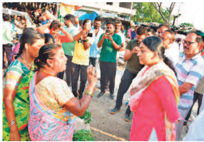
మహబూబాబాద్ మార్కెట్లో జిల్లాగారాలు లామ్మే మహిళా తో మాట్లాడుతున్న ఎంపీ కవిత

మెడక్, ఏప్రిల్ 25 (నమస్తే తెలంగాణ): 'అసెంబ్లీ ముందున్న అమరవీరుల స్తూపం వద్దకు శుక్రవారం రాజీనామా పత్రంతో నేను వస్తా.. దమ్ముంటే నువ్వు వస్తావా?' అని సీఎం రేవంత్ రెడ్డికి మాజీ మంత్రి హరిశ్ చంద్రావు సవాల్ చేశారు. 'అగస్టు 15లోగా రుణమాఫీ చేసేది నిజమైతే, అరు హామీలు అమలు చేస్తే అమరవీరుల స్తూపం వద్దకు రా.. రాజీనామా లేఖలను ఇద్దరం మేధావుల చేతిలో పెడదాం.. నువ్వు చెప్పినవి అమలు చేస్తే నా రాజీనామా లేఖను ఆ మేధావులే స్వీకరిస్తారు. చేయకుంటే నీ రాజీనామా లేఖను గవర్నర్ కు ఇస్తారు. దానిని సిద్ధమేనా అని అడుగుతున్నా. నువ్వు మాట మీద నిలబడేవాడివి అంటే కా.. రాకుంటే తెలంగాణ ప్రజలకు అర్థమేదా. కొడంగల్లో రాజకీయ సన్యాసం తీసుకుంటానని తోక మొడిచినట్లే, ఇప్పుడూ అది అవుతుంది' అని ఎద్దేవా చేశారు. గురువారం బీఆర్ఎస్ ఎంపీ అభ్యర్థి వెంకట్రా మిరెడ్డి నామినేషన్ సందర్భంగా జిల్లా కేంద్రంలోని ధ్యాన రోడ్ విగ్రహం సుంచి రాండన్ చౌరస్తా వరకు భారీ రాళ్ళు నిర్వహించారు. ఈ సందర్భంగా రాండన్ చౌరస్తాలో హరిశ్ చంద్రావు మాట్లాడుతూ.. మెడక్ జిల్లాకు కేసీఆర్ ఏం చేశారని మాట్లాడుతున్న రేవంత్ రెడ్డిని మెడక్ గడ్డ మీదికి తీసుకువచ్చిన ఘన గులాబీ జెండాకే దక్కతుందని స్పష్టం చేశారు. మెడక్ జిల్లాగా ఏర్పడటం వల్లే నామినేషన్ కోసం రేవంత్ రెడ్డి మెడక్ కు వచ్చిన విషయం > 6 వకటి