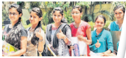
ఇంటర్ ఫలితాల్లో బాలికలదే సైచేయం

ఖలిల్వాడి/కామారెడ్డి, ఏప్రిల్ 24: ఇంటర్ ఫలితాల్లో ఇందూరు బాలికలు స్వతఃకారము. బుద్ధవారం ఇంటర్ బోర్డు ఫస్ట్ యర్, సెకండ్ యర్ ఫలితాలు విడుదల చేయగా నిజామాబాద్ జిల్లా బాలికలు సైచేయం సాధించారు.