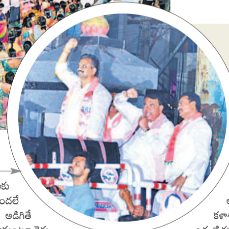
రోడ్ షోలో హాజరైన జనం

కామారెడ్డిలో నిర్వహించిన రోడ్ షోలో హాజరైన జనం