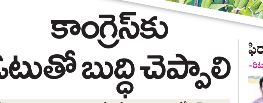
నిజామాబాద్, ఏప్రిల్ 24, (నమస్తే తెలంగాణ ప్రతినది) పసుపు బోర్డు పేలిటే ఎంపీ అర్చనా ప్రకటనలు ఇండ్రజాలాన్ని తలపిస్తున్నాయి.

నిజామాబాద్, ఏప్రిల్ 24, (నమస్తే తెలంగాణ ప్రతినది) పసుపు బోర్డు పేలిటే ఎంపీ అర్చనా ప్రకటనలు ఇండ్రజాలాన్ని తలపిస్తున్నాయి. కన్నది లేనట్లు... లేనిది ఉన్నట్టుగా చిత్రీకరించడంపై రైతులు అసహనం వ్యక్తం చేస్తున్నారు.