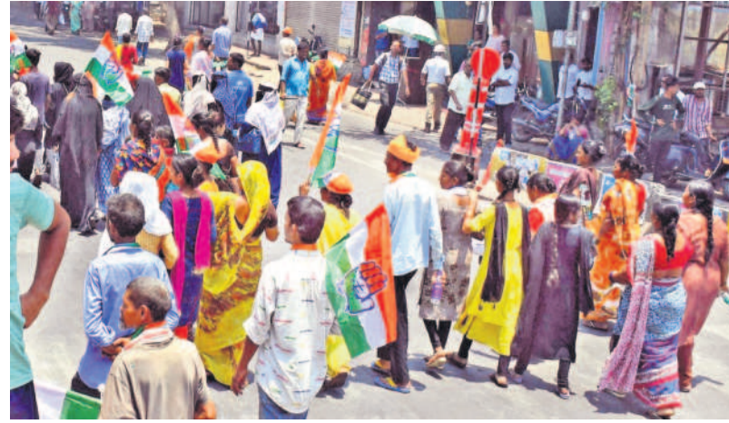
సికింద్రాబాద్ ప్యాట్నీ సెంటర్ కార్డర్ మీటింగ్లో సీఎం రేవంత్ రెడ్డి మాట్లాడుతుండగానే వెళ్లిపోతున్న జనం