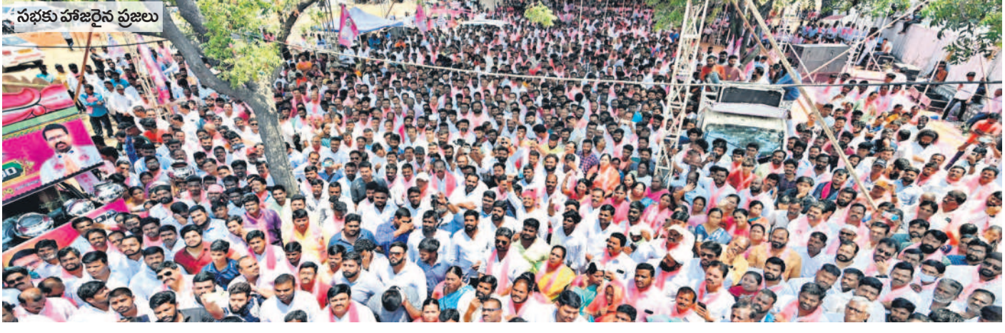
సభకు హాజరైన ప్రజలు