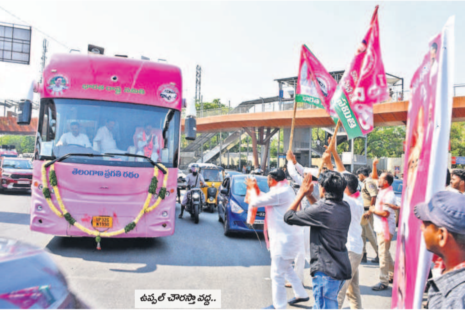
ఉప్పల్ చౌరస్తా వద్ద..

తెలంగాణకు భరోసాగా.. రాష్ట్రవ్యాప్తంగా చేపట్టిన బస్సు యాత్రకు ముఖ్యమంత్రి తెలంగాణ భవన్ నుంచి గులాబీ దళవల కేసీఆర్ శ్రీకారం చుట్టారు. ఈ సందర్భంగా భవన్ లో ఆయనకు మహిళలు బొట్టుపెట్టి.. మంగళపాదాలను పెట్టారు. జై తెలంగాణ.. జై కేసీఆర్ నివాసాలతో జిఆర్ఎస్ శ్రేణులు పోలికలను పెట్టారు. అనంతరం కేసీఆర్ మిర్యాలగూడకు బయలుదేరారు. దారిపొడవునా.. గులాబీ శ్రేణులు, అభిమానులు, ప్రజలు ఆయనకు ఘన స్వాగతం పలికారు.