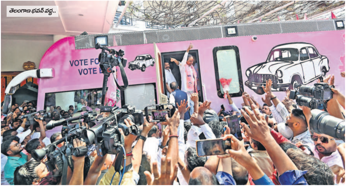
తెలంగాణ భవన్ వద్ద..