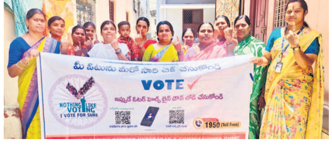
మీ ఓటును మరో సారి చక్క చేసుకోండి

సిటీబ్యూరో, ఏప్రిల్ 24 (నమస్తే తెలంగాణ) : నగరంలో ఓటర్లను చైతన్యపరిచి, ఓటింగ్ శాతం పెంచే దిశగా విస్తృతంగా స్వీట్ కార్యక్రమాలను నిర్వహిస్తున్నారు. అందులో భాగంగా జిల్లా ఎన్నికల అధికారి, జీహెచ్ఎంసీ కమిషనర్ లోనార్డ్ రాస్ అధికారి మేరకు అర్బన్ కమ్యూనిటీ విభాగం అధ్యక్షులతో జిల్లా వ్యాప్తంగా పలు కార్యక్రమాలను చేపట్టి ఓటర్లకు ఓటు హక్కు వినియోగంపై అవగాహన కల్పిస్తున్నారు. ఓటు యొక్క ప్రాముఖ్యతను తెలియజేస్తూ ప్రతి ఓటరు ఓటు హక్కు వినియోగించుకోవాలి రా్యలు, సమావేశాలు నిర్వహిస్తూ ఇంటింటికీ వెళ్లి బొట్టు పెట్టి.. ఓటు ప్రాధాన్యత తెలియజేస్తున్నారు. ప్రజాస్వామ్య వ్యవస్థను బలోపేతం చేయాలి. 'ఓట్ పర్ మూర్తి', 'నేను తప్పకుండా.. ఓటు వేస్తాను' అని ప్రతిజ్ఞ చేయిస్తూ.. అన్ని వర్గాల ప్రజలకు అవగాహన కల్పిస్తున్నారు.