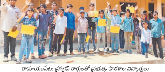
రామాయంపేట: ప్రోగ్రెస్ కార్యకర్తల ప్రభుత్వ పాఠశాల విద్యార్థులు