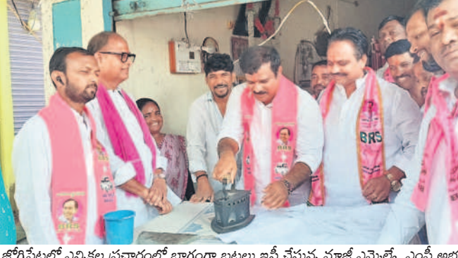
జోగిపేటలో ఎన్నికల ప్రచారంలో భాగంగా బుద్ధులు ఇచ్చే చేస్తున్న మాజీ ఎమ్మెల్యే ఎంపీ అభ్యర్థి