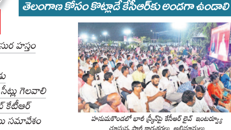
హనుమకొండలో భారీ స్పీచ్ చేసిన కేటీఆర్ లైవ్ ఇంటర్వ్యూ మాస్టర్స్ పార్టీ కార్యకర్తలు, అభిమానులు