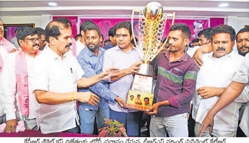
కేటీఆర్ క్రికెట్ కప్ విజేతలకు ట్రోఫీ ప్రదానం చేస్తున్న బీఆర్ఎస్ వర్కింగ్ ప్రెసిడెంట్ కేటీఆర్