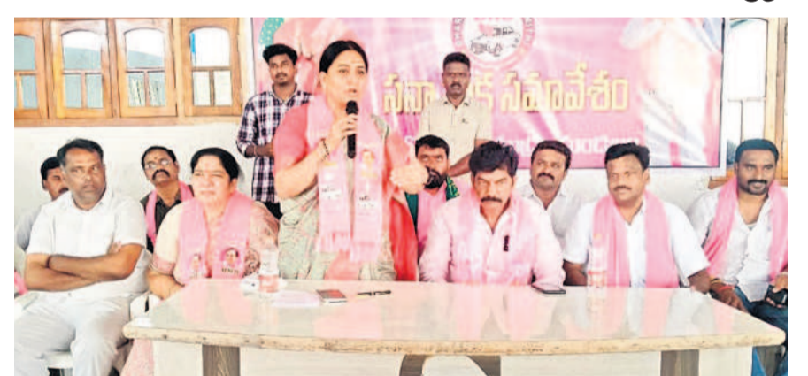
కేసీఎంపిలో మాట్లాడుతున్న ఎంపీ మారోత్ కవిత, చిత్రంలో మాజీ మంత్రి సత్యవతి

కాంగ్రెస్ పాలనలో ఆగమవుతున్న రైతులు రుణమాఫీపై ఆగమవు నెలలో చేస్తారో సీఎం స్పష్టంగా చెప్పాలి