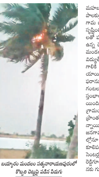
బయ్యారం మండలం సత్తనారాయణపురంలో కొబ్బరి చెట్టుపై పడిన పిడుగు

మానుకోట, జనగామ జిల్లాల్లో జోరువాన విరిగిన చెట్లు, కులిన కరెంట్ స్తంభాలు పలుచోట్ల పిడుగులు, నిలిచిన విద్యుత్ సరఫరా