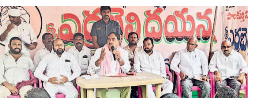
రాయవల్లిలో మాట్లాడుతున్న మాజీ మంత్రి ఎర్రబెల్లి