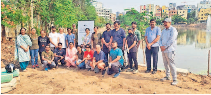
ఫ్యాన్ల వద్దనే ప్లాస్టిక్ అనే ధీమత్ ప్రచారం చేస్తున్న ప్రతినిధులు

మణికోండ, ఏప్రిల్ 21 : పర్యావరణ పరిరక్షణ ప్రతి ఒక్కరి బాధ్యతగా భావించి ప్లాస్టిక్ వాడకాన్ని పూర్తిగా నివారించాలని దృఢపాటుగా సంస్థ సభ్యులు వెల్లడించారు. సెకాంప్రార్, ముప్పిచెరువు, బద్ల కుంటలో ఫ్యాన్ల వద్దనే ప్లాస్టిక్ అనే ధీమత్ ప్రచారం భూమి దివ్య కృష్ణ