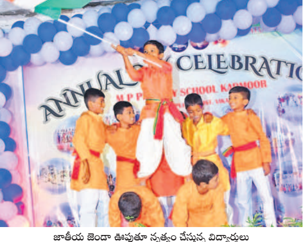
జాతీయ ఔండా ఊపేతూ సృష్టించే పుస్తక విద్యార్థులు