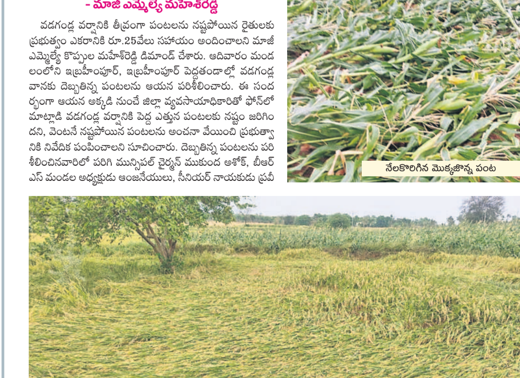
వడగండ్ల వానకు నేలవాలిన వరి పంట