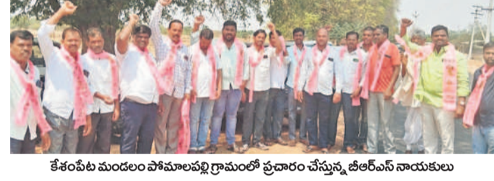
కేశంపేట మండల పోలవరపు గ్రామంలో ప్రచారం చేస్తున్న బీఆర్ఎస్ నాయకులు