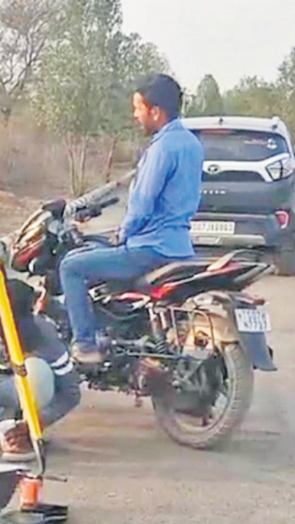
సర్వే చేయడం సంతోషంగా ఉన్నది..