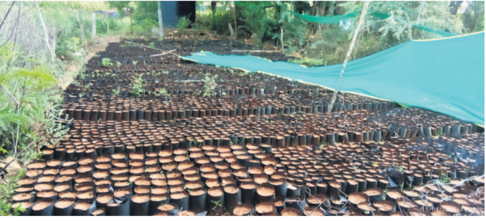
కాస్టోల్లో నర్సరీ నిర్వహణ జిల్లా..

పెద్దకొడవగల్, ఏప్రిల్ 21: రాష్ట్రంలోని హరిత తెలంగాణా మార్చ్ దుకు గత బీఆర్ఎస్ ప్రభుత్వం ప్రతిష్టాత్మకంగా హరిత హారం పథకాన్ని ప్రవేశపెట్టింది. ఎంజీఎన్ఆర్ ఈజీఎస్ డ్యూరా మండలంలోని 25 గ్రామాల్లో ఒక్కో నర్సరీ ఏర్పాటు మొత్తం 25 విలేజ్ నర్సరీలను ఏర్పాటుచేసింది. ఒక్కో నర్సరీలో పది వేల మొక్కలు పెంచేలా ప్రణాళిక రూపొందించారు. మూడు నెలల క్రితమే