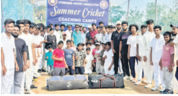
సమ్మర్ క్రామ్స్ నకు ఎంపికైన క్రీడాకారులు