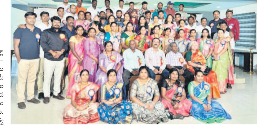
ఆత్మీయ సమ్మేళనంలో పాల్గొన్న పూర్వ విద్యార్థులు

కామారెడ్డి, ఏప్రిల్ 21 : కామారెడ్డి జిల్లా కేంద్రంలోని సీఎస్సీ హైస్కూల్లో 2000-2001 పదో తరగతి బ్యాచ్ వినాయక చవితికి అంబుటెన్సీలో ఆదివారం ఆత్మీయ సమ్మేళనం నిర్వహించారు. 24 సంవత్సరాల తర్వాత కలుసుకొని వినాయక చవితి జానమి నెమరువేసుకున్నారు. అనంతరం నాటి గురువులను ఘనంగా సన్మానించారు. కార్యక్రమంలో ఉపాధ్యాయులు, పూర్వ విద్యార్థులు పాల్గొన్నారు.