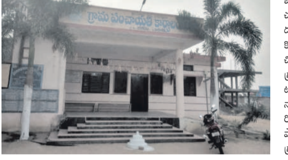
బీబీపేట గ్రామ పంచాయతీ

బీబీపేట, ఏప్రిల్ 21: సర్పంచులు పదవీకాలం పూర్తి కావడంతో రాష్ట్ర ప్రభుత్వం గ్రామాల అభివృద్ధి కోసం స్పెషల్ ఆఫీసర్ల పాలనను తీసుకువచ్చింది. బీబీపేటలో పాటు అయా గ్రామాల్లో స్పెషల్ ఆఫీసర్ల అంబుటెన్సీలో ఉండడంలేదని ప్రజలు అంటున్నారు. గ్రామాలకు స్పెషల్ ఆఫీసర్లు 10 రోజులకోసారి వచ్చి కానీసం 10 నిమిషాలు కూడా ఉండడంలేదని ఆయా గ్రామా పంచాయతీ సిబ్బంది మాట్లాడుతుంటున్నారు. బీబీపేట మండలంలోని