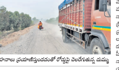
వాహనాలు ప్రయాణిస్తుండడంతో రోడ్డుపై చెలరేగుతున్న దుమ్ము

గాంధారి, ఏప్రిల్ 21: మండలంలోని కామారెడ్డి - బాన్సువాడ ప్రధాన రహదారిపై పాతంగల్ కలాన్ స్టేజీ నుంచి చందానాయక్ తండా వరకు కంకర రోడ్డును