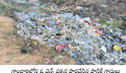
గాంధారిలోని ఓ వైస్ పక్కనే పారవేసిన ప్లాస్టిక్ గ్లాసులు

పడేస్తున్నారు. అయినా అధికారులు పట్టనట్లు వ్యవహరిస్తున్నారు. మండల కేంద్రంలోని చర్లలో రోడ్డుకు వెళ్లేదారిలో పల్లెట్ రూమ్ ఉన్నది. అక్కడ వ్యర్థాలను డంపింగ్ యార్డుకు తరలించకుండా రోడ్డు పక్కనే పారేస్తున్నారు. దీంతో రోడ్డు ప్రయాణం చేసేవారు వాటి నుంచి వచ్చే దుర్వాసంతో తీవ్ర ఇబ్బందులు ఎదుర్కొంటున్నారు. గాలిదుమారం వచ్చినప్పుడు ప్లాస్టిక్ గ్లాసులు రోడ్డుపైకి కొట్టుకురావడంతోపాటు సమీపంలో ఉన్న ఇండ్లలోకి చేరుతున్నాయి. ఇప్పటికైనా అధికారులు స్పందించి ప్లాస్టిక్ వ్యర్థాలను రోడ్డు పక్కనే పారవేస్తున్న వైస్ నిర్వాహకులపై చర్యలు తీసుకోవాలని స్థానికులు కోరుతున్నారు.