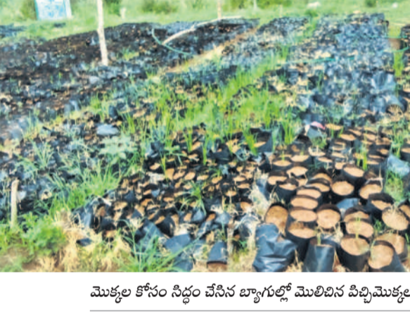
మొక్కల కోసం సిద్ధం చేసిన బ్యారన్లో మొలకైన పచ్చిమొక్కలు

ప్రభుత్వ పథకాలపై అవగాహన ఎల్లారెడ్డి, ఏప్రిల్ 21: కాంగ్రెస్ ప్రభుత్వం అమలుచేస్తున్న పథకాలను మండలంలోని ఉత్పన్నులకు గ్రామస్థులకు ఎల్లారెడ్డి ఎమ్మెల్యే మండలిమోహన్ రావు వివరించారు. మండలంలోని ఉత్పన్నుల గ్రామంలో ఆయన ఆదివారం ఎన్నికల ప్రచారం నిర్వహించారు. జహీరాబాద్ కాంగ్రెస్ లోకసభ అభ్యర్థి సురేశ్ షెట్టార్ ను గెలిపించాలని కోరారు. ఆయనవెంట నాయకులు, కార్యకర్తలు ఉన్నారు.