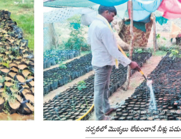
నర్సరీలో మొక్కలు లేకుండానే నీళ్లు పడుతున్న పనిసేవకుడు