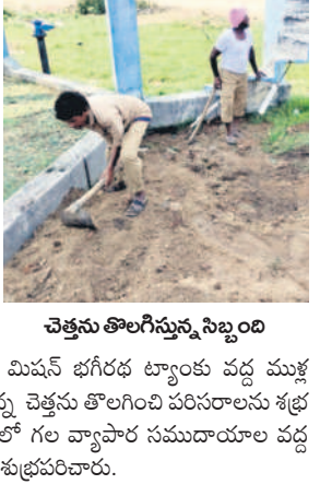
చెత్త తొలగిస్తున్న సిబ్బంది