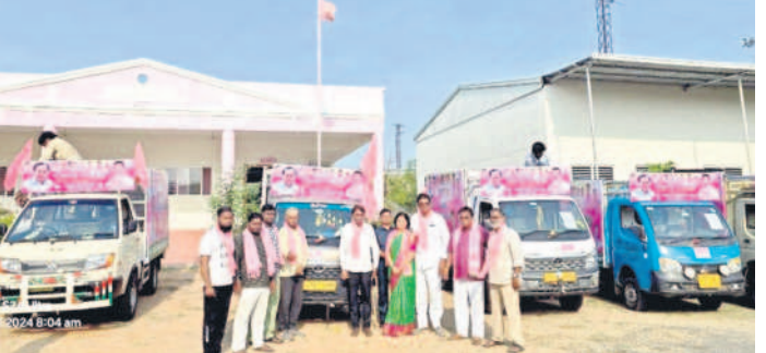
సోన్ : ప్రచార రథాలకు పూజలు చేసి ప్రారంభిస్తున్న జడ్పీ చైర్మన్ విజయలక్ష్మి