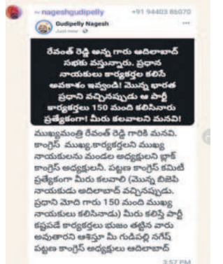
కాంగ్రెస్ నాయకుల సోషల్ మీడియాలో వైరల్ పోస్ట్