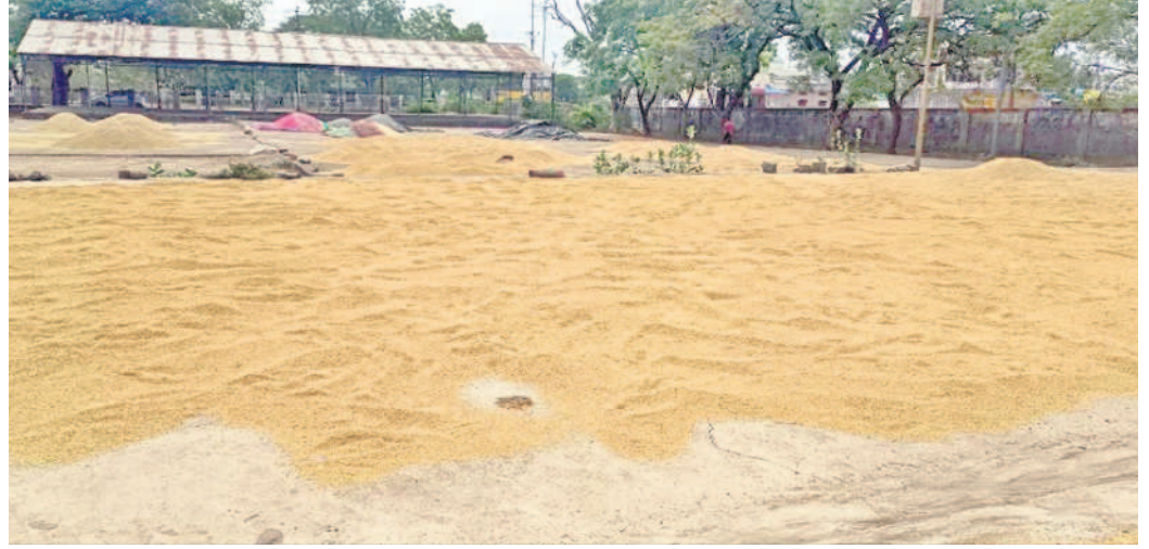
ఖానాపూర్ లోని కొనుగోలు కేంద్రంలో రైతులు అరబోసిన వరి ధాన్యం

యాసంగి ధాన్యం కొనుగోలు అధికారులు, కాంగ్రెస్ సర్కారు నిర్లక్ష్యం చేయడంతో ఆరుగంటల వరకు రైతులు తీవ్ర అందోళన చెందుతున్నారు. వాతావరణంలో మార్పులతో అల్పవత్తుగా ఉండటం వల్ల అధికార యంత్రాంగం ఇందుకు పూర్తి భంగం వ్యవహరిస్తున్నది. ఈ యాసంగిలో నిర్మల్ జిల్లా వ్యాప్తంగా కొనుగోలు కేంద్రాల ప్రారంభం అయినప్పటికీ మారుమూల కేంద్రాల్లో అధికారులు నిబంధనలు పాటించడం లేదు. ఇందుకు నిదర్శనంగా ఖానాపూర్ పీడిఎస్ కొనుగోలు కేంద్రం నిలుస్తున్నది. వారం రోజులుగా వరికోతలు ముప్పురంగా కొనసాగుతున్నాయి. ధాన్యం అందోళనలకు కర్షకులు కొనుగోలు కేంద్రాలకి తీసుకురాగా అధికారులు మాత్రం రైతులకు కనీస సౌకర్యాల కల్పించడం లేదు. తీసుకురావాలి, వాన జల్లులతో తమకు భారీ నష్టం వాటిల్లే ప్రమాదం ఉందని చెబుతున్నా.. వర్షం వస్తే తప్పక రైతులకు రైతుల నిర్లక్ష్యం వ్యవహారం అందోళనలు తప్పవని హెచ్చరిస్తున్నాడు.