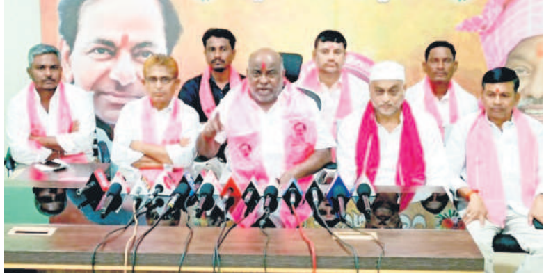
విలేజరుల సమావేశంలో మాట్లాడుతున్న మాజీ మంత్రి జోగు రామన్న