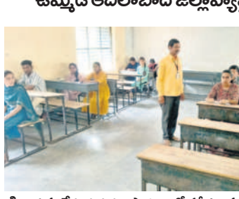
గింజన సంక్షేమ గురుకుల పాఠశాలలో పరీక్ష రాస్తున్న విద్యార్థులు

ఉమ్మడి ఆదిలాబాద్ జిల్లా వ్యాప్తంగా 4,437 మంది హాజరు