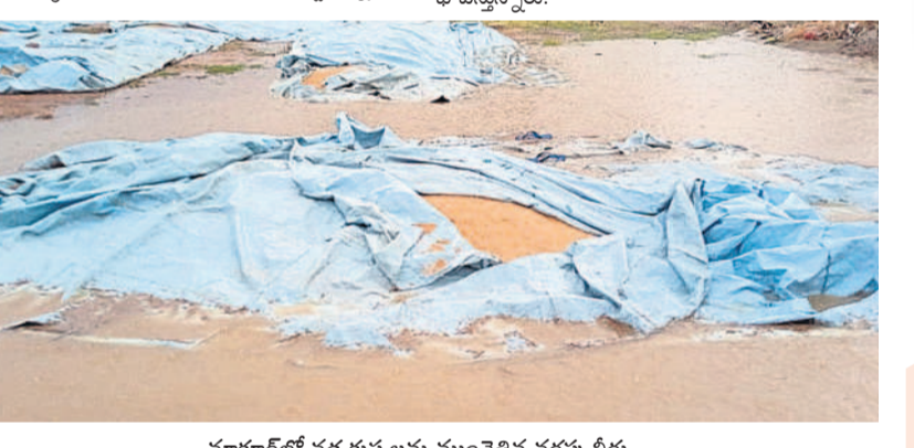
మాక్లూర్లో వడ్ల కుప్పలను ముంచెత్తిన వర్షపు నీరు

అపార నష్టం.. మాచారెడ్డి మండలంలోని ఎల్లవేట, సోమరపేట క్షేత్ర పరిధిలో 120 ఎకరాల్లో పంట నష్టం వాటిల్లినట్లు కామ రెడ్డి ఏడీఎ అప్పల వెప్పారు. మాక్లూర్ మండలంలో రోడ్డు అరబోసిన ధాన్యం తడిసి ముద్దయింది. కోతకు వచ్చిన పంట నేలకొరిగింది. మామిడికాయలు నేల రాలాయి. ధాన్యం కుప్పలు కొట్టుకుపోయాయి. నందిపేట మండలంలో 50 ఏడుగ్రామ స్థానాలు నేలకొరిగాయి. 5 ట్రాక్టర్లు పాల్వర్రు దెబ్బతిన్నాయి. వడగండ్ల వానతో 230 ఎకరాల్లో వరి, ఐదు ఎకరాల మామిడి పంటకు నష్టం వాటిల్లింది. నవీపేట మండలంలో దాదాపు 80 ఎకరాల్లో పంటలు దెబ్బతిన్నాయి. కొనుగోలు కేంద్రాల వద్ద ఆరబెట్టిన ధాన్యం నీళ్లపాలైంది. 25 ఏడుగ్రామ స్థానాలు పడిపోయాయి. ఈదురు గాలులకు ధర్మాణం గ్రామంలో మూడు రేకుల పెద్ద దెబ్బతిన్నాయి. కమ్మిగిరి మండలంలో చిత్తపాలెం నువ్వులు, నజ్జ పంటలకు తీవ్ర నష్టం వాటిల్లింది. అమీరపగల్, సర్పంచి తండా గ్రామాల్లో నివాస గృహాలు, గుడిసెలు పాక్షికంగా దెబ్బతిన్నాయి.