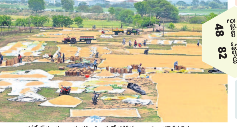
నవీపేట మండలం అనంతగిరి శివారులో తడిసిన ధాన్యాన్ని అరబెట్టిన రైతులు

నస్రూబాద్, ఏప్రిల్ 20 : బీర్కూర్ మండలంలో ధాన్యానికి రైన్ మిల్లుకు ఒక్కో లాటికి మూడు నుంచి ఐదు క్వింటాళ్ళ తరగు తీసున్నారని రైతులు శనివారం ఆందోళన చేశారు. బీర్కూర్ ప్రాథమిక సహకార సంఘం వద్దకు చేరుకొని సిబ్బందిని ఘెరావ్ చేశారు. అనంతరం రైన్ మిల్లు వద్దకు తీసుకోవాల్సిన కోరుతూ తహసీల్దార్ లకు ఫిర్యాదు చేశారు.