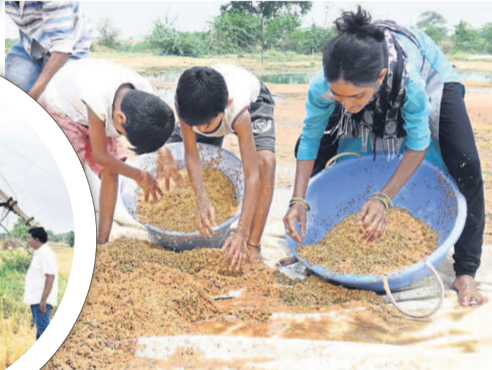
నిజామాబాద్ రూరల్ మండలం ఆకుల కొండూర్లో వర్షపునీటి నుంచి వడ్లును ఎత్తుకున్న మహిళా రైతు, బిన్నూరులు

ఖలేజ్/కామారెడ్డి, ఏప్రిల్ 20: నిజామాబాద్ జిల్లాలో అకాల వర్షాలకు 623 మంది రైతులకు చెందిన 907 ఎకరాల్లో పంట నష్టం జరిగినట్లు జిల్లా వ్యవసాయశాఖ అధికారి వాణిజ్యసర్పంచ్ శనివారం ఒక ప్రకటనలో తెలిపారు. కామారెడ్డి జిల్లాలో 81 మంది రైతులకు సంబంధించి 114 ఎకరాల్లో పంట నష్టం జరిగినట్లు జిల్లా వ్యవసాయ అధికారి ఖాళిగట్టి తెలిపారు.