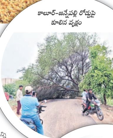
కాలూర్-జన్నేపల్లి రోడ్డుపై కూలిన వ్యక్తం

అకాల వర్షం అన్నదాతను ఆగమాగం చేసింది. ఈదురుగాలులతో కూడిన వాన.. రైతున్నకు తీరని నష్టాన్ని మిగిల్చింది. శుక్ర, శనివారాల్లో కురిసిన అకాల వర్షంతో నిజామాబాద్, కామారెడ్డి జిల్లాల్లో వండల ఎకరాల్లో పంటలు దెబ్బతిన్నాయి. చెదగొట్టు వానలకు తోడుగా గాలి దుమారం తీవ్రంగా చేలు చేసింది. దీంతో అరుగులం సాగుచేసిన పంట చేతికొచ్చే సమయంలో వర్షానికి నేలకొరిగింది. పంటకు పెట్టబడి కూడా మిగలకపోవడం రైతున్నకు కంటి తడి పెట్టే స్థాయి. ప్రభుత్వ కొనుగోలు కేంద్రాల్లో తేమ పేరుతో ఇబ్బందులు పెడుతుండడంతో వడ్ల రాకులను ఎండకు ఆరబెట్టుగా ఆకాల వర్షంతో భారీ నష్టం వాటిల్లింది. చాలాచోట్ల కళ్ల ముందే వర్షపు నీటిలో వడ్లు కొట్టుకుపోవడంతో రైతున్నకు అవేదన వ్యక్తమవుతోంది. ఆకాల వర్షాలతో పంటలు దెబ్బతిని, రైతున్న తీవ్ర ఇబ్బందుల్లో ఉంటే.. ఎన్నికల హడావుడిలో ప్రభుత్వ యంత్రాంగం, రాజకీయ కార్యక్రమాల్లో అధికార పార్టీ నేతలు గడుపు తున్నారు. నష్టపోయిన అన్నదాతలకు అందగా నిలువకపోవడం గమనార్హం. -నిజామాబాద్, ఏప్రిల్ 20 (నమస్తే తెలంగాణ ప్రతినిధి)