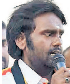
బీజేపీకి బలమే లేదు!

మామూ ప్రధాన పార్టీలలో ఒక్క కేసీఆర్ మాత్రమే టిక్కుపాటు లేకుండా రాజకీయంగా చేస్తున్నారు. ఆయన అండరి కంటే ముందున్నాడు. రాజకీయాల్లో గెలుపొపొ ములు సహజం. గెలిచినప్పుడు అవర చాచుకుంటారు.. ఓడిపోతే ఇదేం పూహం అంటారు. అందుకే... పులికా అలో సంబంధం లేకుండా మాన్య కేసీఆర్ చాలా వేగంగా ఉన్నట్లే తక్కు.