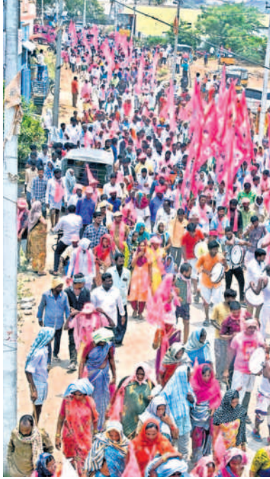
అర్వపల్లిలో ప్రచారానికి భారీ హాజరైన జనం