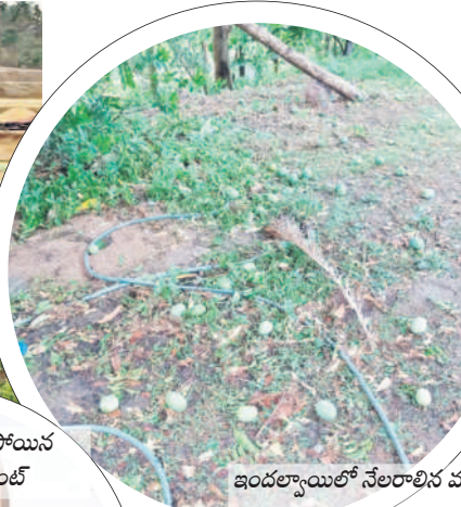
ఇందల్వాయిలో నేలరాల్చిన మామిడి