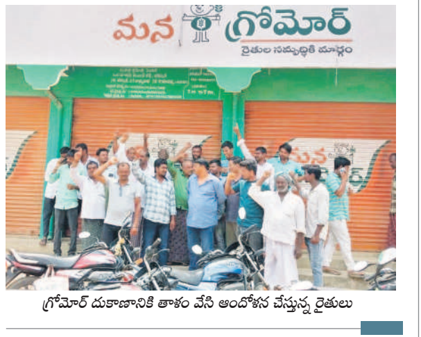
గ్రోమార్ దుకాణానికి తాళం వేసి ఆందోళన చేస్తున్న రైతులు

నవ్రాబాద్, ఏప్రిల్ 19: బీరూర్ మండల కేంద్రంలో విక్రయించిన నకిలీ విత్తనాలతో రైతులు మోసపోయిన విషయం తెలిసింది. నకిలీ విత్తనాలతో సాగుచేసిన పంటలను కొన్ని రోజుల త్రితం వ్యవసాయశాఖ అధికారులు, గ్రోమార్ కంపెనీ వారు పరిశీలించారు. రైతులతో మాట్లాడి ఈ నెల 12వ తేదీలోగా నష్ట పరిహారం అందజేస్తామని హామీ ఇచ్చారు. గడువు ముగిసి వారంరోజులు గడుస్తున్నా సప్తపదివారం ఇవ్వకపోవడంతో రైతులు ఆగ్రహం వ్యక్తం చేశారు. శుక్రవారం గ్రోమార్ దుకాణానికి తాళం వేసి ఆందోళన చేశారు.