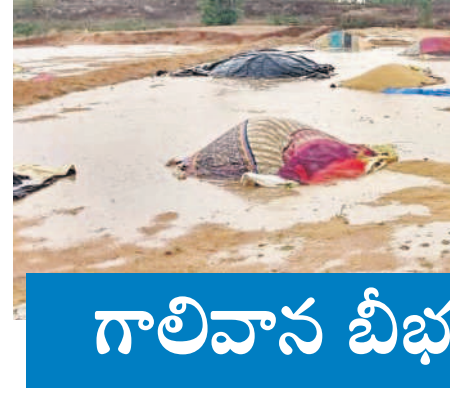
మావారెడ్డి మండలం ఎల్లంపేట్లో వడ్ల కుప్పల మట్టా వేలన వద్దపు నీరు