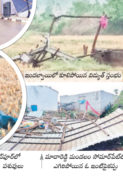
ఇందల్వాయిలో కూలిపోయిన విద్యుత్ స్తంభం