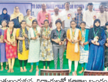
బహుమతులను పంపిణీ చేసే కళాశాల బృందం