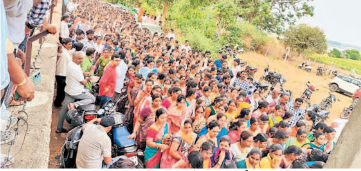
శుక్రవారం చిలుకూరు బాలాజీ ఆలయానికి పెద్ద సంఖ్యలో తరలివచ్చిన భక్తులు..