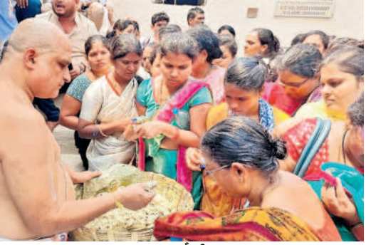
గరుడ ప్రసాదం పంపిణీ చేస్తున్న పూజారులు