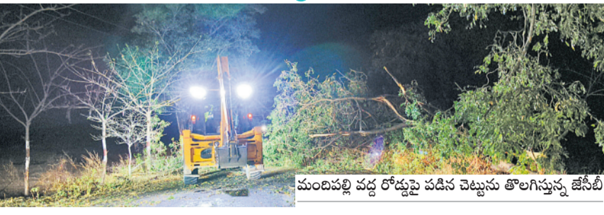
మందిపల్లి వద్ద రోడ్డుపై పడిన చెట్టును తొలగిస్తున్న జేసీబీ

కన్నీ బ్యాగులుంటేనే కొనుగోళ్లు.. కలెక్టర్ల పీఏసీసీఎస్ పరిధిలో 24 కేంద్రాలను ప్రారంభించారు. కానీ గన్నీ బ్యాగులు ఉంటేనే కొనుగోలు సాధ్యమవుతుంది. అధికారులను అడిగితే పస్తాయి అంటున్నారు తప్పా ఎప్పుడోస్తాయో చెప్పడం లేదు. రైస్ మిల్లల వద్ద తీసుకోవడం అధికారులు ఉచిత సలహాలిస్తున్నారు. పోసి వాళ్ళ వద్దే తీసుకుంటామన్నా అది చినిగిపోయాయి. రైతులు ప్రతి రోజూ ఫోన్ చేసి దాన్యాన్ని ఎప్పుడు కొనుగోలు చేస్తారని అడుగుతున్నారు. వారికి ఏం చెప్పాలో అర్థం కావడం లేదు. తల్లిన అనుభవం.. రోజులు కావచ్చుంది. ఇప్పటి వరకు గన్నీ బ్యాగుల కోసం ఎదురుచూపులు తప్పడం లేదు. యాసంగిలో అకాల వరాలు కురిసే అవకాశం ఉన్న నేపథ్యంలో రైతులు బీజేపీ తరఫున పంటను అమ్ముతున్నందుకు సంసిద్ధమయ్యారు. కొనుగోలు కేంద్రాల్లో ఏ గ్రేడ్ రకానికి క్లింటుకు ధర రూ.2,260, బీ గ్రేడ్ రూ.2,240 చెల్లిస్తున్నారు. కానీ, గన్నీ బ్యాగుల కొరతతో రైతులు ప్రైవేట్ వ్యాపారులను ఆశ్రయించడంతో ఇదే అయిదుగా భావించి నిలుపుకోవడం మొదలుపెట్టారు. తరుగు, తేమ పేరుతో క్లింటుకు 5 నుంచి 6 కిలోల వరకు కోత పెడుతున్నారు. ధర కూడా రూ.1,800 నుంచి రూ.2వేల వరకు మాత్రమే నిర్ణయిస్తున్నారు. ఇదేంటని అడిగితే ఇష్టం ఉంటే అమ్మండి లేకుంటే వెళ్లండి ధాన్యం దిగుబడి ప్రారంభమై దాదాపు 20