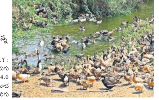
భూదాన్ పోషకంపై మండల రేవెన్యూ గ్రామ శివారులో ఎండ వేడికి తాళలేక పొరుగున కాల్యాల తోడుతున్న బాతులు

భువనగిరి కలెక్టరేట్, ఏప్రిల్ 17 : ఎండల తీవ్రత రోజురోజుకూ పెరుగుతున్నది. జిల్లాలో బుధవారం 44.6 డిగ్రీల అత్యధిక ఉష్ణోగ్రతలను నమోదు చేశారు. జిల్లాలోని యాదగిరిగుట్టలో గరిష్ఠంగా 44.6 డిగ్రీలు, పలిగిండలో 43.4, ఆలేరు గిలసూకొండలో 43.8, బొమ్మలరామారం మర్కాలలో 43.2, మోతూరు బుజిలాపురంలో 42.8, చౌటుప్పల్లో 42.8, అత్తకూరు(ఎం)లో 42.7, రామన్నపేటలో 42.6, సంస్థాన నారాయణపురంలో 42.3, భువనగిరి నందంనలో 42.2, భూదాన్ పోషకంపై జిల్లాపౌరంలో 41.8, బొమ్మలరామారం, గుండాల, మోటకొండూరు మండలలో 41.7, రాజాపేట పాముకుంటలో 41.4,