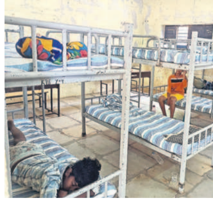
భువనగిరి సాంఘిక సంక్షేమ గురుకుల పాఠశాలలో చికిత్స పొందుతున్న విద్యార్థులు

ఫుడ్ పాయిజన్ తో ఎంతో మంది విద్యార్థులు వాంతులు, విరేచనాలతో ఇబ్బందిపడడం