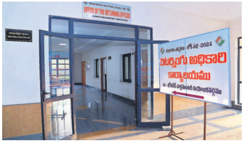
యాదాద్రి భువనగిరి కలెక్టరేట్లో పూర్వ యన్ పిర్సన్లు